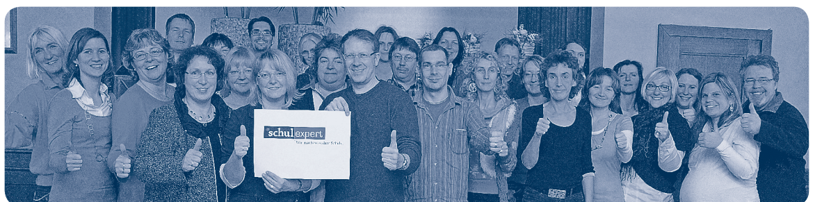
Das Team Schulexpert: Die Deutsche Fernschule in Wetzlar