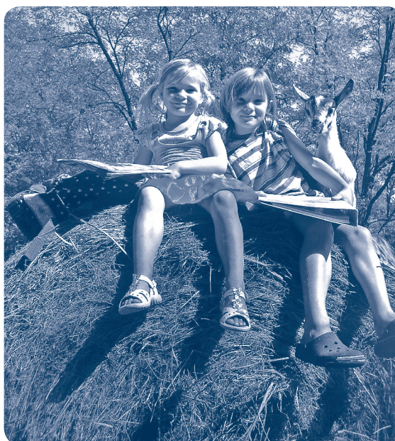
Schüler der Fernschule in Ungarn