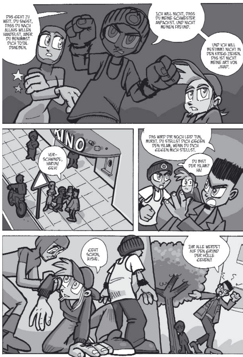
Andi 2 | In die Hölle

Aber: Geht es bei der Bedeutung der Popularisierung in der Erwachsenenbildung nur um ein Vereinfachen wissenschaftlicher Erkenntnisse? Dass in den Veranstaltungen neue Erkenntnisse verständlich gemacht werden oder auch alte in einer neuartigen, der gegenwärtigen Zeit passenden Form vorgetragen werden? Bestimmte Erscheinungsformen würden dieses Verständnis eventuell fördern, wenn z.B. neue Erkenntnisse und Entdeckungen zum Klimawandel oder zur Welternährung, zum demographischen Wandel oder zum Populismus (s.o.) allein aufgrund ihrer Neuheit als Thema festgelegt und dann vermittelt werden sollen. Zugegebenermaßen ist dies auch interessant. Es fehlt dann aber ein vielfältiges Einbeziehen des eigenständigen Denkens und Beobachtens der Teilnehmer. Es ist fraglich, inwieweit sie zu abweichenden oder kritischen Erkenntnissen kommen können. Ähnliches findet man bei den Quizsendungen, und es vielleicht macht dies manches unterschwellige Unbehagen an ihnen aus.