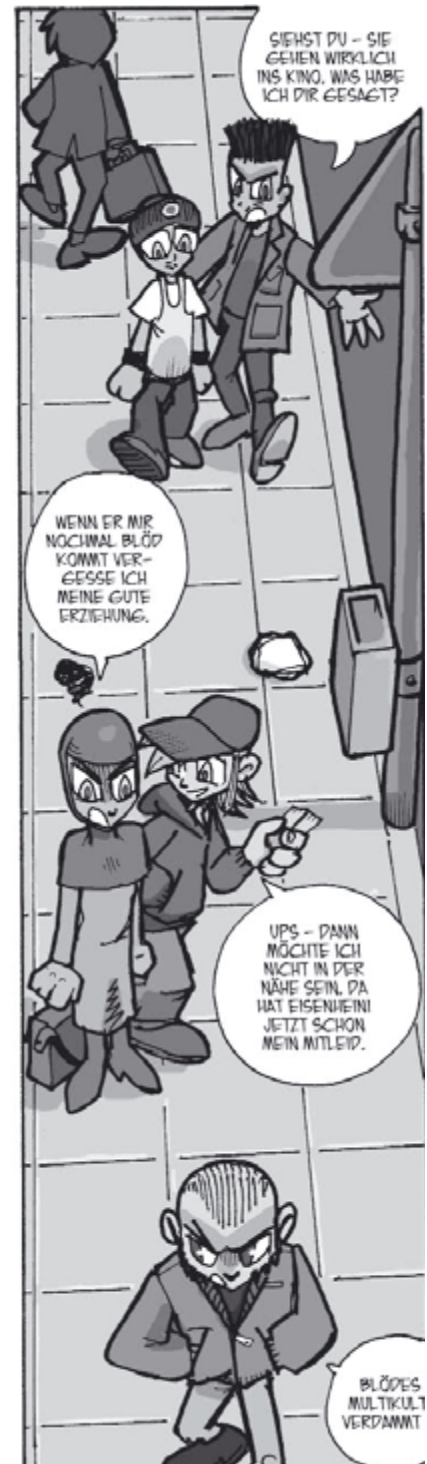
Andi 2 | Kino?

Bildungsmaßnahmen, die sich aus einem solchen Verständnis nahelegen, beschäftigen sich z.B. mit der Auflösung populärer Missverständnisse.