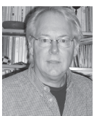
Prof. Dr. Rainer Brödel ist Lehrstuhlinhaber für Erwachsenenbildung und außerschulische Jugendbildung an der Westfälischen Wilhelms-Universität Münster.

Den Autoren um Peter Hubertus zufolge stellt eine noch ungelöste Frage dar, wie mit Interessenten oder Teilnehmenden an Alphabetisierungskursen im fortgeschrittenen Alter zu verfahren sei. 5 Bei Älteren »wird es trotz bester Förderung und größter Motivation sehr schwer sein, die Zone des funktionalen Analphabetismus zu verlassen« 6 . Mit der angeführten Beobachtung deutet sich allerdings ein Ausschlusskriterium an. Es dürfte in seiner Ambivalenz nicht unwidersprochen bleiben,