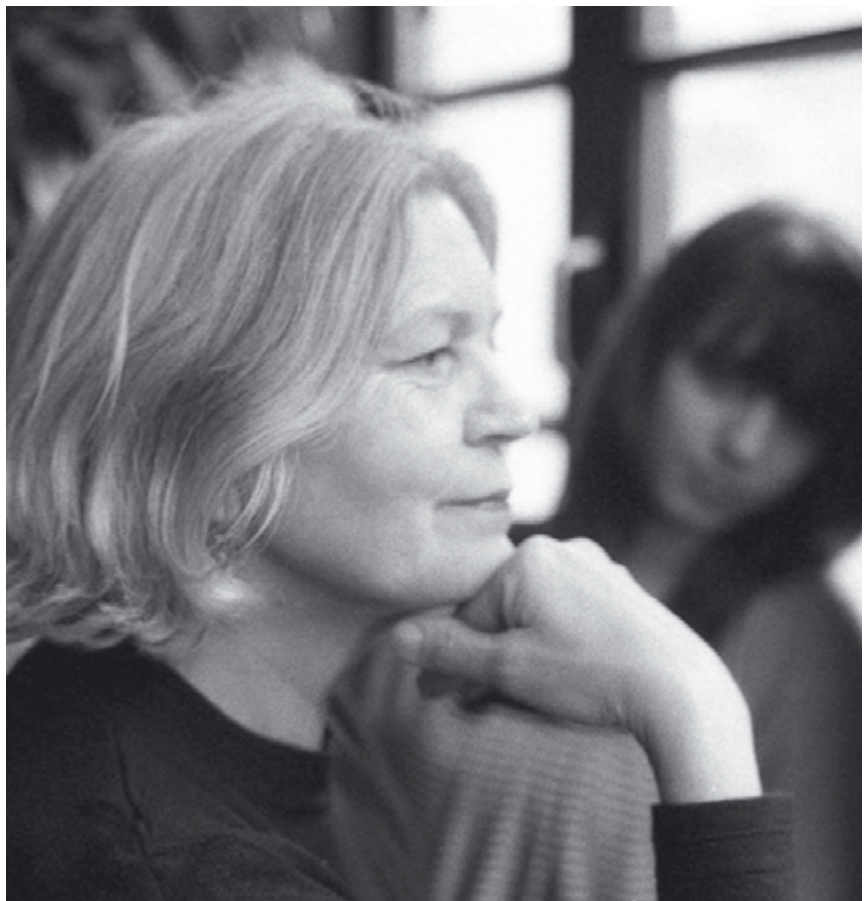
Generationen | Verstehe!

Diese Fragen spielen in der Vorbereitung intergenerationaler Lernveranstaltungen eine wichtige Rolle. Ihre Reflexion kann nach unseren Erfahrungen helfen, das bisher vielleicht noch nicht bedachte intergenerational Potenzial der eigenen Einrichtung zu erkennen und zu nutzen. In jedem Fall ist es sinnvoll, die Generationen, die eingeladen werden sollen, bewusst auszuwählen, sich ihre Lernbedürfnisse zu vergegenwärtigen und das Angebot konkret daraufhin zu entwickeln. In der Auswertung des Modellprojekts wurde zudem deutlich, dass zwischen genealogisch-orientierten, gemeinschaftsorientierten und differenzorientierten Lernarrangements unterschieden werden kann, die für unterschiedliche Zielgruppen intergenerationalen Lernens geeignet sind