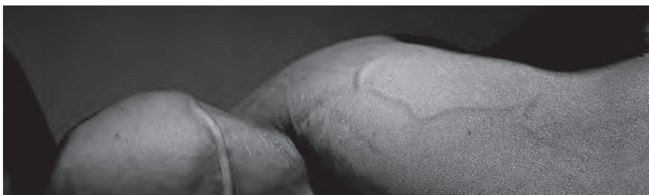
Kraft-Akt | Insel mit zwei Bergen

Die Schönheit, die sexuelles Glück und beruflichen Erfolg verspricht, kann man kaufen, wie die Werbung zeigt: vom Stil der Kleidung, die dem individuellen Typ gerecht wird, über die richtige Pflege der Haut bis hin zu Tattoos und operativen Genitalverschönerungen. Die Kommodifizierung