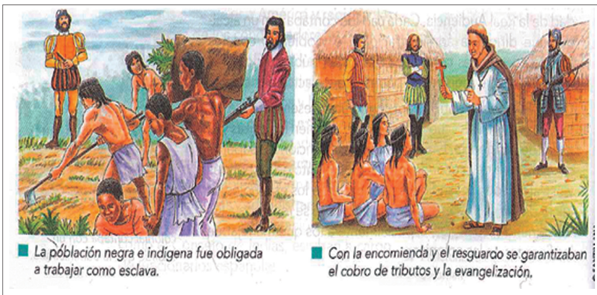
■ La población negra e indígena fue obligada a trabajar como esclava.

Las acciones colectivas se evidencian en los libros de texto desde actividades de carácter comunitario que desarrollan los grupos étnicos como la minga y la siembra.