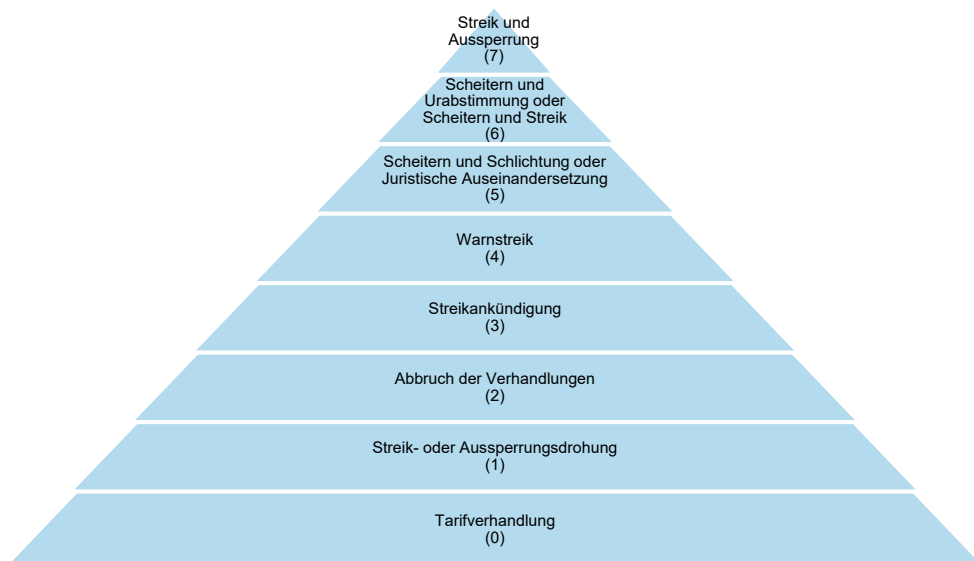
Abb. 1: Die Eskalationspyramide (Quelle: Lesch (2013a)).

In der ersten Eskalationsform berufen die Tarifparteien einen neutralen Schlichter, dessen Aufgabe darin besteht, eine weitere Eskalation durch trilaterale Verhandlungen zu vermeiden. Eine erfolgreiche Schlichtung beendet den Konflikt, ohne dass ein materieller Schaden auftritt. Die Konflikthandlung Scheitern und Schlichtung wird als fünfte Eskalationsstufe (und damit eine Stufe höher als der Warnstreik) bewertet, obwohl sie eine neue Friedenspflicht begründet. Es darf während der Schlichtung weder zum Streik aufgerufen werden, noch ein Warnstreik organisiert werden. Es wäre daher denkbar, die Eskalationsform Scheitern und Schlichtung zwischen dem Verhandlungsabbruch und dem Streikaufruf zu verorten. Gegen diese Überlegung spricht, dass die Gewerkschaften den Warnstreik als Druckmittel nutzen, um sich bilateral mit den Arbeitgebern zu einigen. Er ist nicht darauf angelegt, den Konflikt trilateral im Wege der Schlichtung zu lösen. Verhandlungstaktisch ist die Schlichtung dem Warnstreik demnach nachgelagert. Im Ablaufschema der Tarifverhandlung ist die Schlichtungsphase ebenfalls einem relativ späten Stadium zuzuordnen (Keller, 1985, S. 119). In der Regel finden Warnstreiks statt, bevor das Scheitern der Verhandlungen erklärt wird und ein Schlichtungsmechanismus greift. Der Warnstreik will ein Scheitern ja gerade verhindern. Daher stellt das Scheitern gegenüber dem Warnstreik auch dann eine Eskalationsverschärfung dar, wenn es mit einer Schlichtung verbunden ist.