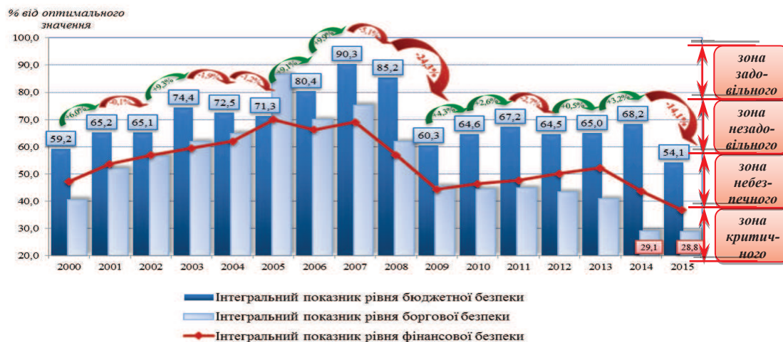
Рис. 1. Динаміка субіндексів складників фінансової безпеки України протягом 2000–2015 рр.*

надходжень від основних бюджетноутворювальних податків за посилення фіскального тиску на економіку, різкою девальвацією національної валюти, значним зростанням державного та гарантованого державою боргу з посиленням ризиків настання дефолту, неліквідності й неплатоспроможності фінансових установ, скороченням ресурсної бази банків, проблемами з їх капіталізацією. Це визначило критичний і близький до критичного стан майже всіх складників фінансової безпеки (рис. 1).