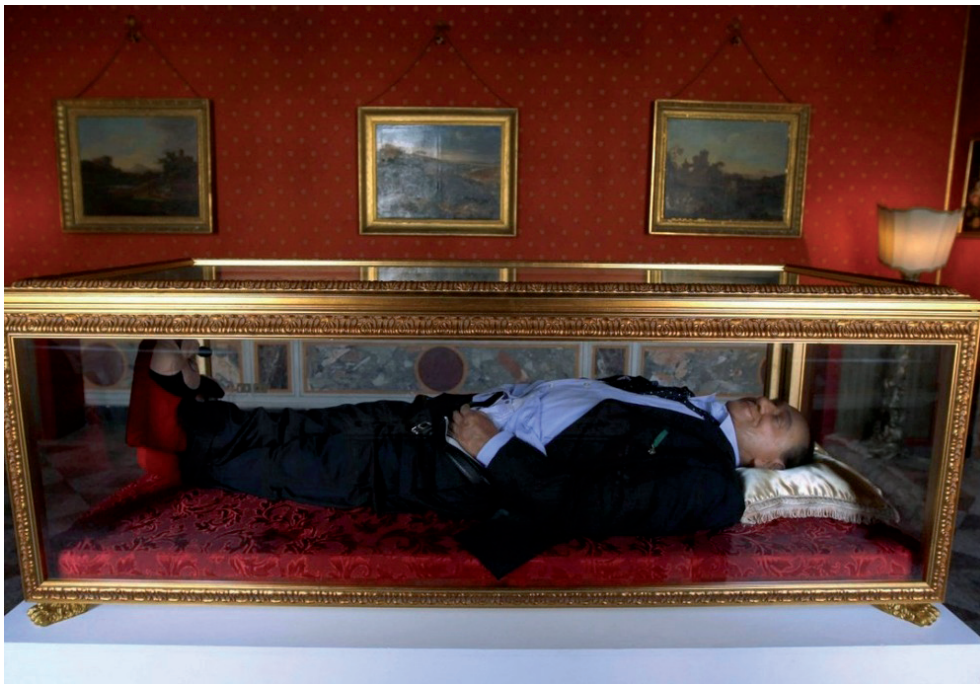
Abb. 1: „Il sogno degli italiani“. Installation von Antonio Garullo und Mario Ottocento, 2012. © A. Garullo/M. Ottocento

Wie differenziert die unterschiedlichen Aspekte des Phänomens Sarg und seine Funktionen als Verpackungsmedium sein können und wie mit einer guten Prise Ironie traditionelle Formen der Leichenpräsentation aktuell umgesetzt werden, wird an einer aufsehenerregenden Installation aus dem Mai 2012 deutlich.