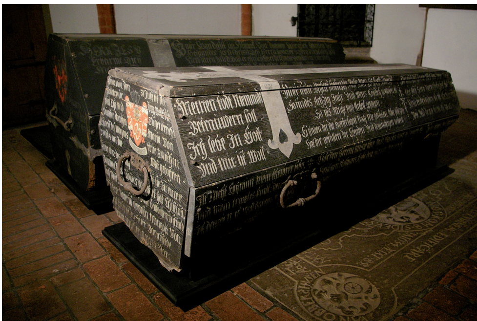
Abb. 2: Sarg der Äbtissin Dorothea Maria von Estorff (gest. 1680) aus der Äbtissinnengruft im Kloster Lüne in Lüneburg.

Die besondere Ausstattung kann zugleich als Ehrung des Verstorbenen verstanden werden, um ihm eine angemessene letzte Wohnstatt zu gewährleisten. Religiöse Bekenntnisse in Form von Kreuzifixen und anderen christlichen Symbolen sowie ein entsprechendes Spruchprogramm auf dem Sarg bezeugen sowohl die Frömmigkeit des Verstorbenen als auch seiner Familie. Persönliche Frömmigkeit kann jedoch auch der Repräsentation und somit zur Inszenierung bzw. Erhöhung der eigenen Person und ihres Umfeldes dienen.