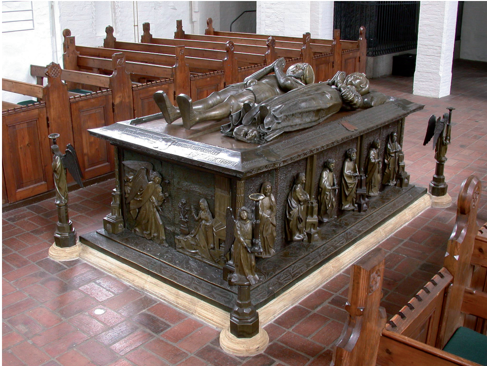
Abb. 6: Tumba der Anna von Brandenburg und Friedrichs I. von Schleswig-Holstein-Gottorf.

Wie alle monumentalen Grabmäler dient auch dieses der memoria , also dem ehrenden Andenken an die Verstorbenen. Zusammen mit den genannten Stiftungen bildet das Grabmal einen erweiterten Memorialaspekt, denn sowohl Chor als auch Schiff werden so als Bühne eines Gesamtkunstwerks des Gedenkens bespielt. Sichtbar stellt sich das Herrscherpaar in den Dienst der Kirche, was beim Betreten des Gotteshauses offenbar wird. Der Besucher wird vom auf der Tumba liegenden Paar, das zum Chor hin weist, empfangen, erfasst dann dort das Gestühl als wichtigen Teil des Zeremonialraumes, nämlich als Sitz des Klerus, und als Höhepunkt eines der kostbarsten Kunstwerke seiner Zeit, den Altar mit einer bis dahin nicht gesehenen lebhaften Darstellung der Passion Christi auf einem der umfangreichsten nordeuropäischen Retabel mit beinahe 400 Figuren. Verlässt der Besucher die Kirche wieder, blickt er den Stiftern noch einmal ins Angesicht. Diese Erfahrung ist in ihrer Gesamtheit seit der Überführung des Altars in den Schleswiger Dom, die Herzog Christian Albrecht 1666 veranlasste, so nicht mehr zu erleben.