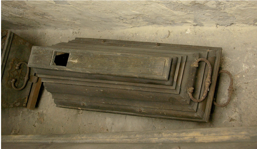
Abb. 4: Kindersarg mit Sichtfenster in der Gruft unter der Berliner Parochialkirche.

dann angenehmer, wenn der Verwesungsvorgang bereits ein Maß erreicht hatte, das aufgrund des Geruchs eine gewisse Distanz erforderlich machte.