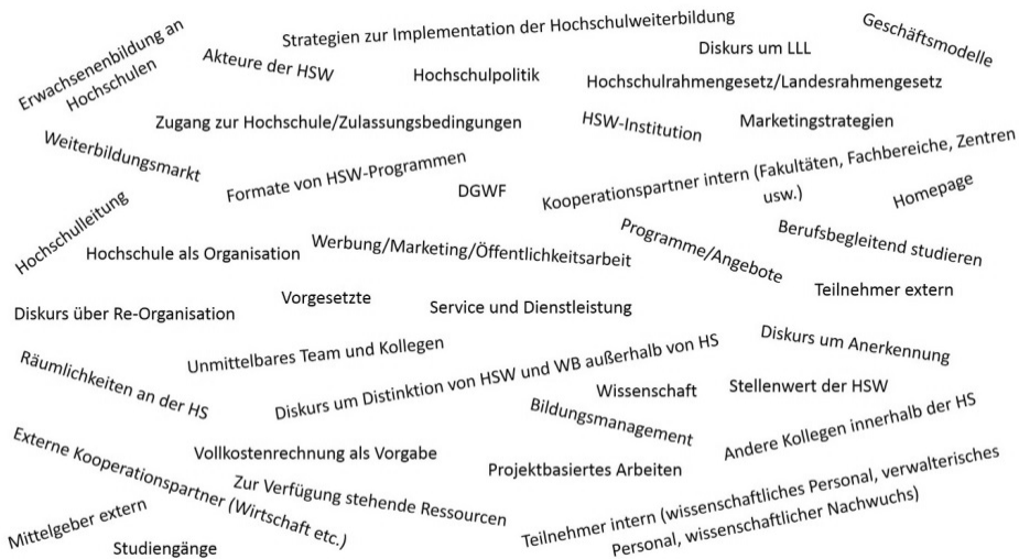
Abbildung 1: Abstrakte Situations-Map in ungeordneter Arbeitsversion

Diese abstrakte Situations-Map (Abbildung 1) entstand zu Beginn der Forschungsarbeit und wurde fortwährend erweitert und ergänzt. Die Erstellung der Map ließ über die Forschungssituation in Gänze nachdenken und brachte zuvor noch nicht gesehene und berücksichtigte Aspekte hervor, die für die Erschließung des Forschungsgegenstandes bedeutend waren. Diese Map bildete die Grundlage für alle weiteren Mappings. So hat „projektbasiertes Arbeiten“ in einem späteren Schritt über projektformiges Arbeiten als Kennzeichen der Tätigkeiten zur Beschreibung des Projekt-Arbeitsbogens geführt.