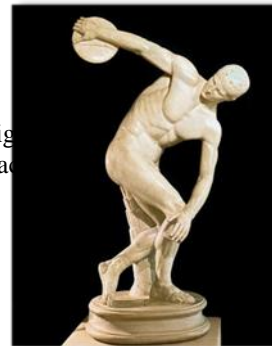
Fig. 2. Arte clássica: Ilustração.

As formas de arte analisadas na seção anterior são denominadas por Hegel de formas particulares na medida em que as artes belas universais se objetivam no mundo exterior de forma singular, particularizando e concretizando uma das formas de concepções de mundo em obras de arte propriamente ditas, passam a ser denominada de artes particulares , vinculando-se a um dos tipos de formas de artes universais.