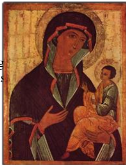
Fig. 1. Arte medieval: Ilustração.

Depois da análise das formas de arte quanto à relação da ideia com a sua figuração imagética, expondo assim concepções de mundo nas formas das artes simbólicas, clássica e romântica, compreendendo que elas “[...] consistem na aspiração, na conquista e na ultrapassagem do ideal como verdadeira Idéia da beleza” (HEGEL, 2001, p. 96), respectivamente, a seguir serão analisadas as artes particulares propriamente ditas, segundo a classificação proposta por Hegel em seu Curso de Estética .