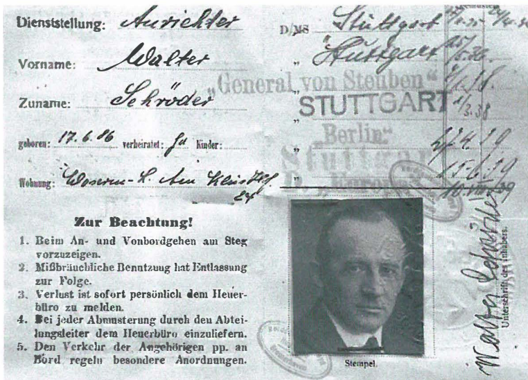
Bordpaß aus dem Jahre 1939. Umschlag und Innenansicht.

straße verlegt. Da der Krieg das Gebäude zerstörte, wurde das Heuerbüro nach dem Krieg in der Schleusenstraße wiedereröffnet.