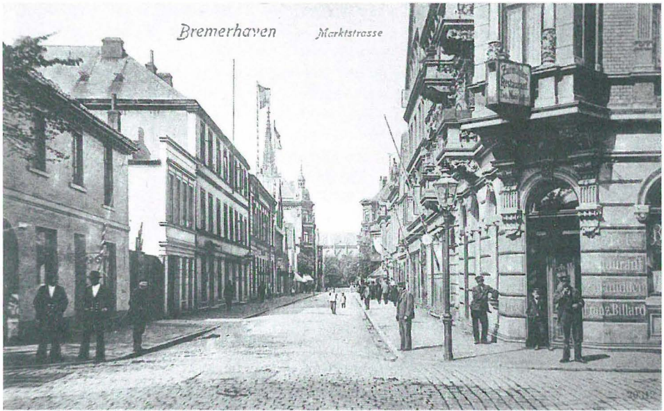
Bremerhaven um 1900.

von Jonquières und dem aus Neufahrwasser bei Danzig stammenden Bootsmann Düsterbeck zu folgendem Dialog: