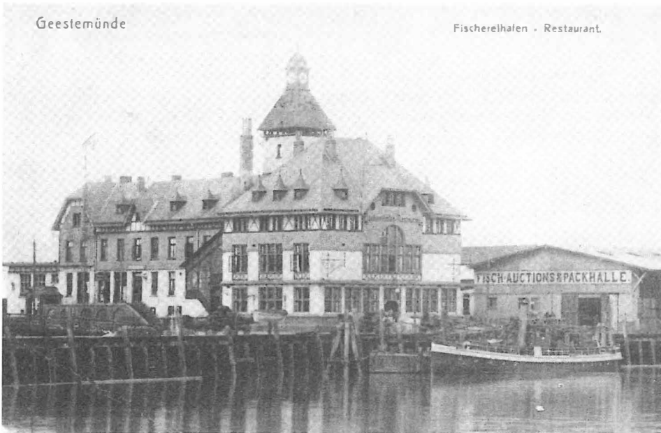
In dem Restaurationsgebäude neben der Auktionshalle befand sich eine Heuerstelle, ein Postbüro und ein Seemannsheim. Postkarte von 1896. (Aus Schlechtriem: Bremerhaven in alten Ansichtskarten. Frankfurt 1977.)

infolge eines leichten Dienstvergehens entlassen worden war oder noch nie beim NDL gefahren war.