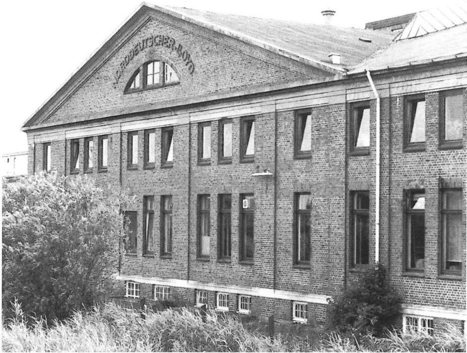
Die Heuerstelle in der ehemaligen Wäscherei des Norddeutschen Lloyd.

ein« genannt. In den Zeitungen wurde auf dieses Ereignis mit der Hoffnung verwiesen, daß sich die Einrichtung als nützlich erweisen werde. 67 In Bremen hatte der Rhederverein bereits seit 1901 seine eigene Heuerstelle. Die Bremerhavener Heuerstelle war Vermittler für die dem Verein angeschlossenen Reedereien, während der NDL und die Bremerhavener Fischerei weiterhin eigene Vermittlungsbüros betrieben.