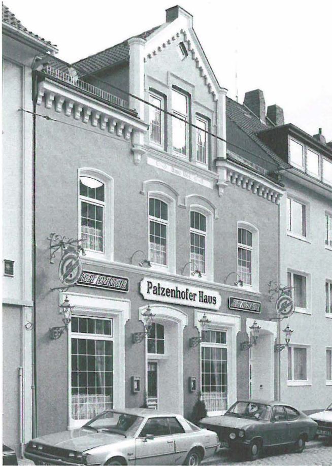
Haus des ehemaligen Heuerbaases Th. Blank, seit Januar 1984 als Gaststätte genutzt.