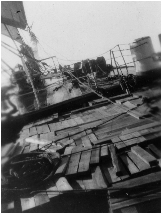
Abb. 3 Holz, bei Sturm eine gefährliche Ladung.