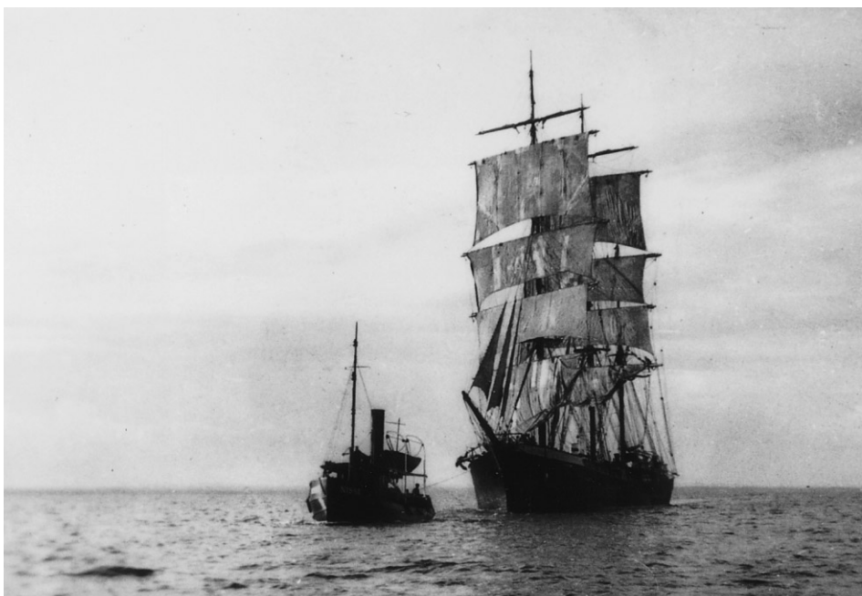
Abb. 2 Die Bark LINGARD, 1933.

Musiker, er hat in den Londoner Bierlokalen jedesmal sehr gut vorgespielt, so daß wir oft umsonst unser Bier bekamen. Ich hatte mein Bandonion von zu Hause mit an Bord gebracht und spielte darauf in meiner freien Zeit. Die Finnen und Schweden, aber auch die anderen Seemänner, waren sehr ehrliche Leute, man kannte z.B. kein Schloß an Bord. Hatte man auf der Back etwas liegen gelassen und mußte fort, so fand man es abends auf seiner Koje wieder. Im übrigen hatten wir im Logis einen Kampf gegen Flöhe. Es hieß, »wir werden nur noch gebissen, weil wir Neulinge sind«. Das Essen war zu jeder Zeit sehr gut und sehr reichlich. Kein Vergleich zu dem Dreimastgaffelschoner ANNEMARIE aus Hamburg, auf dem ich 1931 als Moses fuhr. Schon in London mußte ich öfter in die Masten. Nach kurzer Zeit saß ich auf der Nock einer Rahe genau so sicher, wie in einem Sessel zu Hause. Das galt auch auf den »Pferden«, man stand nach kurzer Zeit da so sicher wie zu Hause auf einem Perserteppich.