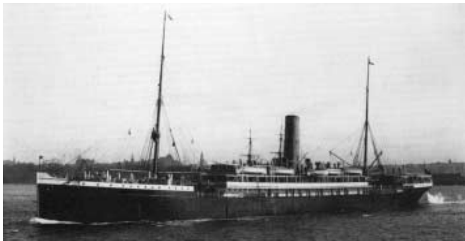
Abb. 4 Dampfer GERA. (Aus: Arnold Kludas: Die Seeschiffe des Norddeutschen Lloyd. Band 1: 1857 bis 1919. Herford 1991, S. 48 / Foto: Ian J. Farquhar)

1901, bei einem Aufenthalt in der chinesischen Hafenstadt Shanghai, brechen Abelbecks Aufzeichnungen ohne erkennbaren Grund ab. Bis zum offiziellen Ende der Reise, am 31. Mai 1901, existieren keine weiteren Eintragungen.