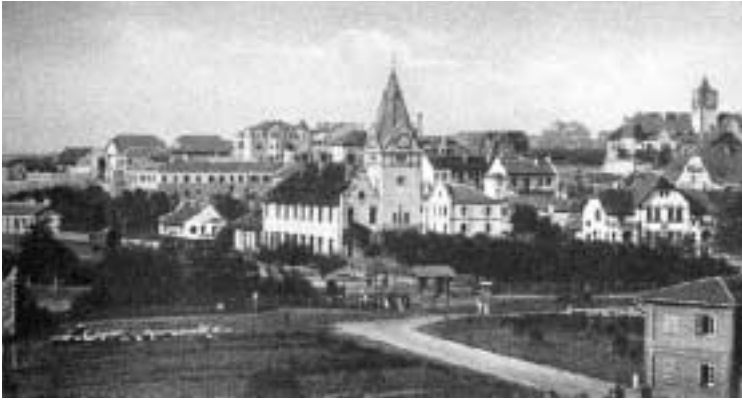
Abb. 6 Die deutsche Kolonie Tsingtau, ca. 1910.

Sonntags zum Gottesdienst blasen wir regelmäßig, auch bei Geburtstagen der Ärzte und bei Beerdigungen. Der erste, der hier auf dem Schiff starb, wurde ins Meer gesenkt bei Shang Hai. Seit 14 Tagen sind wir hier und haben auch schon zwei Beerdigungen, wo wir auf dem Kirchhof zu blasen hatten. Wir haben immer noch oft die Gelegenheit, daß wir des Herrn Lob durch unser Blasen verherrlichen dürfen. Sonst geht es uns allen sehr gut, alle Einwirkungen der langen Reise haben wir glücklich überwunden. 43