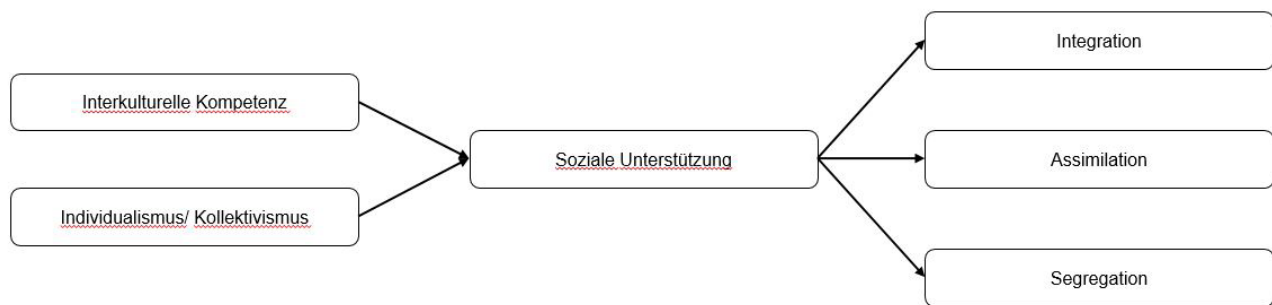
Abbildung 2: Strukturgleichungsmodell zu Hypothese 3

Bei den Messinstrumenten wurde auf bereits validierte Skalen zurückgegriffen. Der Fragebogen war für beide Befragungsgruppen identisch aufgebaut und begann mit der Skala der sozialen Identität von Orth, Broszkiewicz und Schütte (1996) zur Erfassung des kulturellen Zugehörigkeitsgefühls zu verschiedenen Gruppen. Die russischstämmige Substichprobe erhielt Aussagen bezüglich ihres Zugehörigkeitsgefühls gegenüber Russen oder Deutschen, für die deutsche Substichprobe wurde hinsichtlich europäischer und deutscher Zugehörigkeit differenziert (Orth / Broszkiewicz / Schütte 1996). Die Probanden der russischen Gruppe beantworteten zwei Items mehr, da für sie zusätzlich die beiden Items Manchmal habe ich Heimweh nach Russland und In Deutschland habe ich eine neue Heimat gefunden aufgenommen wurden. Zur Skalenbildung wurden für jede Testperson ein Mittelwert der entsprechenden Items gebildet. Hieraus ergeben sich für die deutsche Stichprobe die drei gewichteten Konstrukte deutsche, europäische und biculturelle Identität. Für die russische Stichprobe ergeben sich dahingegen die gewichteten Konstrukte russische, deutsche und biculturelle Identität. Grundlage für die Bildung dieser Konstrukte ist die Annahme, dass die Items gleichwertig behandelt werden können.