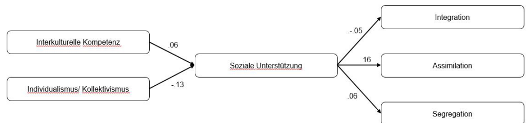
Abbildung 3: Strukturgleichungsmodell zu Hypothese 3, Werte stellen standardisierte Regressions-

Zur Überprüfung der dritten Hypothese wird ein komplexeres Modell zur Vorhersage der Akkulturationsstrategie herangezogen. Es wird angenommen, dass Interkulturelle Kompetenz und die Kultur (Individualismus vs. Kollektivismus) die Akkulturationsstrategie beeinflussen, dieser Effekt wird durch die soziale Unterstützung moderiert. Ein solches Modell konnte für die Stichprobe der Studie nicht bestätigt werden. Die standardisierten Regressionsgewichte sind in Abbildung 3 dargestellt. Der Modellfit muss insgesamt als unzurei-