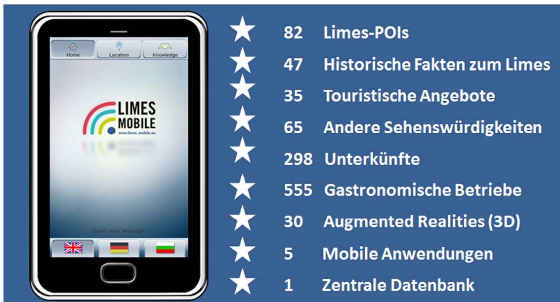
Abb. 3: Fakten zur App LIMES Mobile