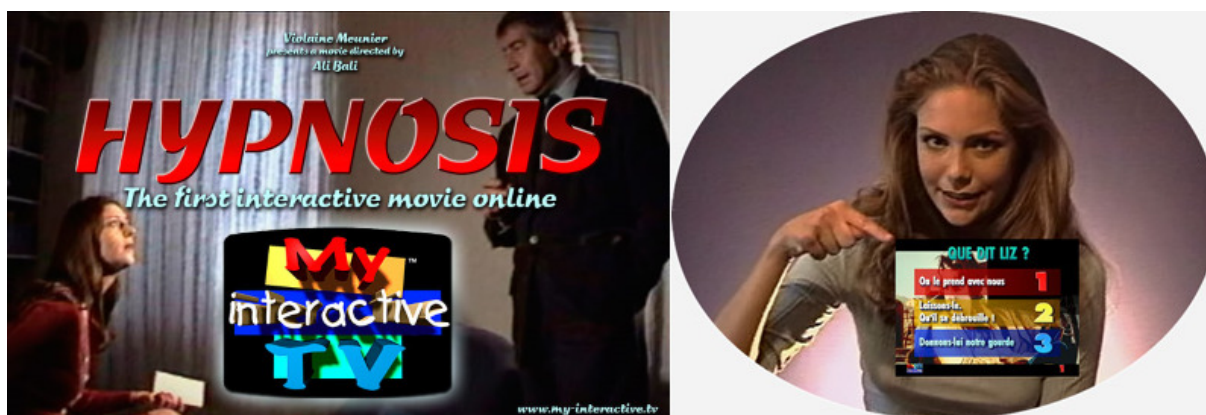
Figura 1 – Capa e opções final de cena do filme Hypnosis

"Intruder" (1998); estes são os títulos dos trabalhos nos quais, além da história poder ser sempre reiniciada, o espectador pode também alterar o jogo de poder entre as personagens e mudar o rumo da história. Neste mesmo festival, também foi apresentado o filme português "Neblina" de 2014 que é o primeiro filme do projeto "Os Caminhos que se Bifurcam". Através da imersão na narrativa interativa, pretende-se criar um efeito de espelho entre o espectador que intervém e o protagonista da ação, tornando-se um espectador-protagonista. Apesar de a narrativa ser pré-definida, a forma como é vivenciada depende diretamente das escolhas do espectador-protagonista. "Neblina" divide-se em três fluxos distintos: um central e dois laterais, estando um escondido à esquerda e o outro escondido à direita. A escolha dos fluxos será realizada pelo espectador-protagonista.