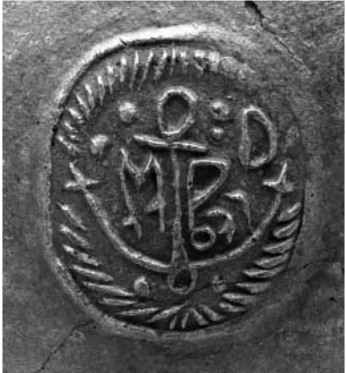
Rechts: Abb. 6 Applikation auf Krug 3 mit Anker und abgekürztem Namen MPD von Matthias Paffendorff nach 1710.

trotz nur einmaliger Erhaltung nicht für ein Einzelstück halten, sondern muß ihn als Teil einer Serie werten. Daß es durchaus üblich war, Steinzeugserien auf diese Weise zu kennzeichnen, zeigt z.B. eine vergleichbare Applikation mit Handelsmarke, den Initialen H L A und der Jahreszahl 1694, die auf einer in Bremen ausgegrabenen Scherbe von Duinger Steinzeug und stempelgleich auf einem Humpen aus dem Münchener Kunsthandel erscheint. 15