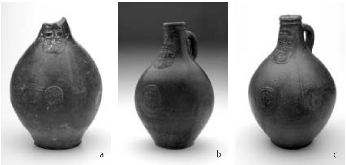
Abb. 1 Die drei Bartmannskrüge des DSM: a. Krug 1 von der Amrumbank, Höhe 31 cm; b. Krug 2 aus Bombay, Höhe 28 cm; c. Krug 3 aus dem deutschen Kunsthandel, Höhe 33 cm.

Bartmannskrüge sind wasserdichte Krüge aus salzglasiertem Steinzeug, die verhältnismäßig großes Fassungsvermögen mit einer engen und deshalb leicht verschließbaren Öffnung verbinden. Sie tragen am Hals gegenüber vom Henkel als Schmuckauflage die namensgebende Abfor-