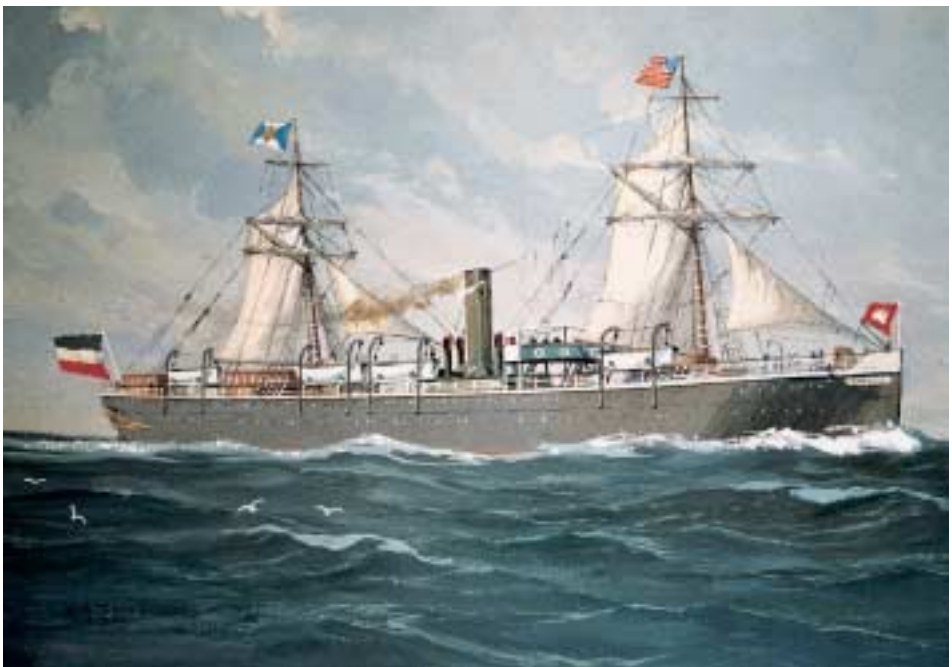
Dampfer GERMANIA. Gouache von Eduard Edler. (Privatbesitz in Schleswig-Holstein)