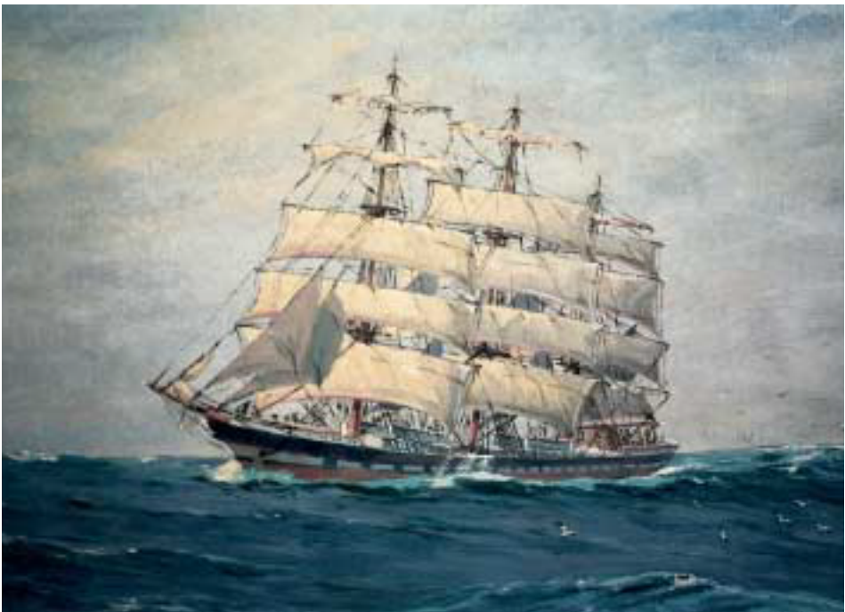
Vollschiff am Winde. Ölgemälde von Eduard Edler. (Privatbesitz in Schleswig-Holstein)