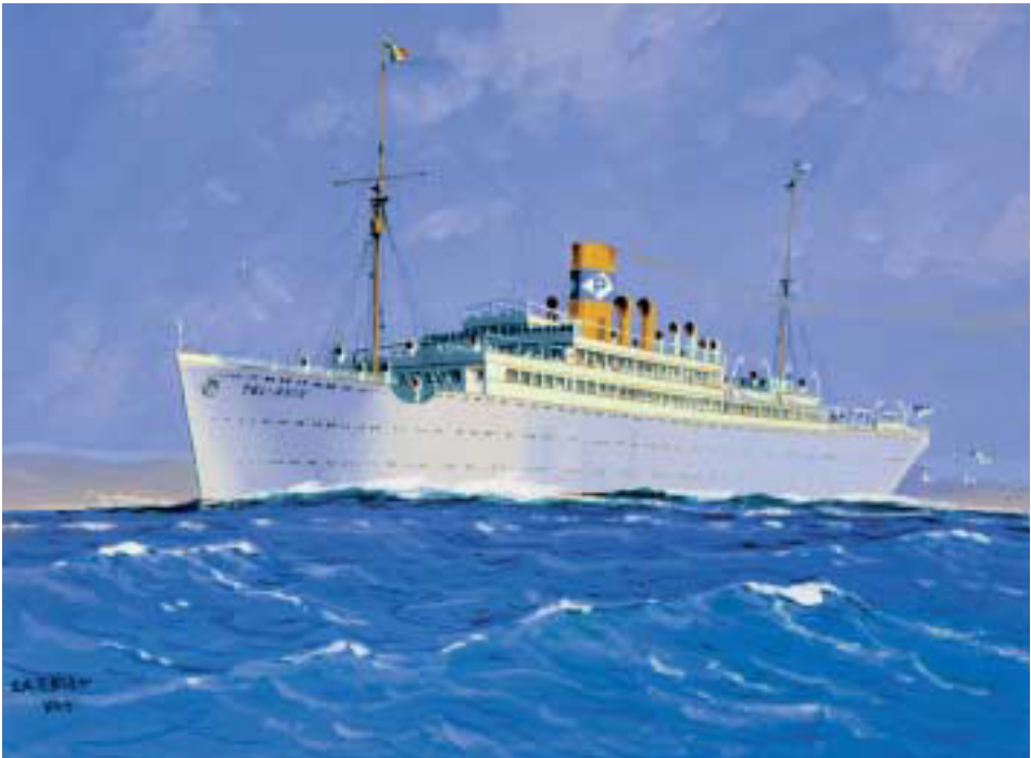
Dampfer TEL AVIV. Gouache von Eduard Edler. (Deutsches Schifffahrtsmuseum)