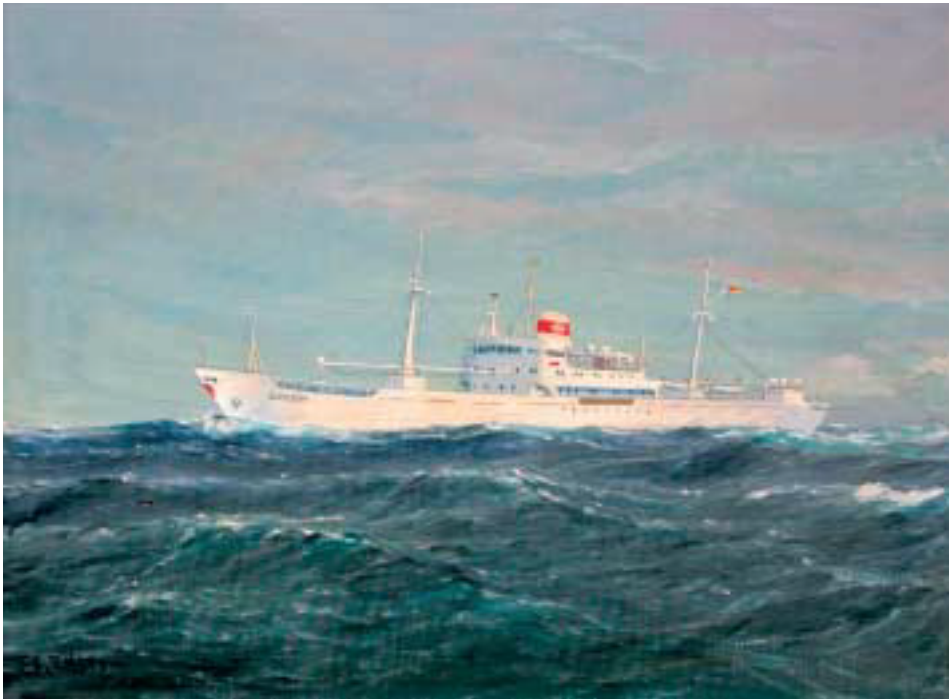
Kühlmotorschiff ELSELETH. Ölgemälde von Eduard Edler.