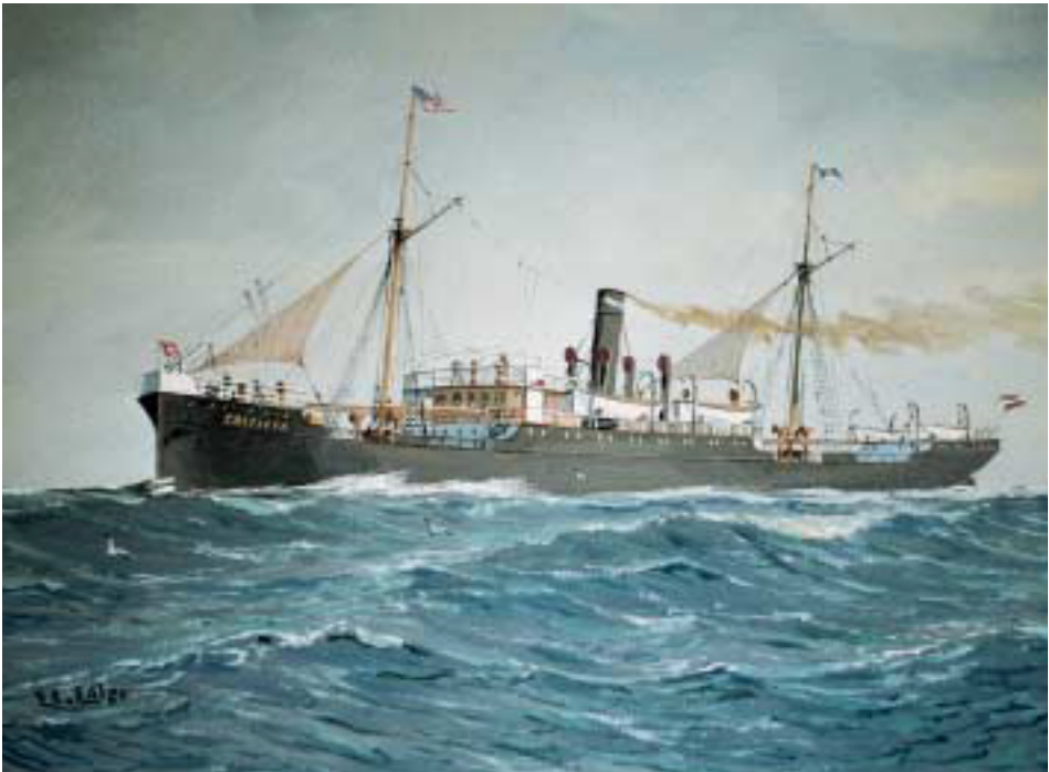
Dampfer CASTILIA. Gouache von Eduard Edler. (Privatbesitz in Schleswig-Holstein)