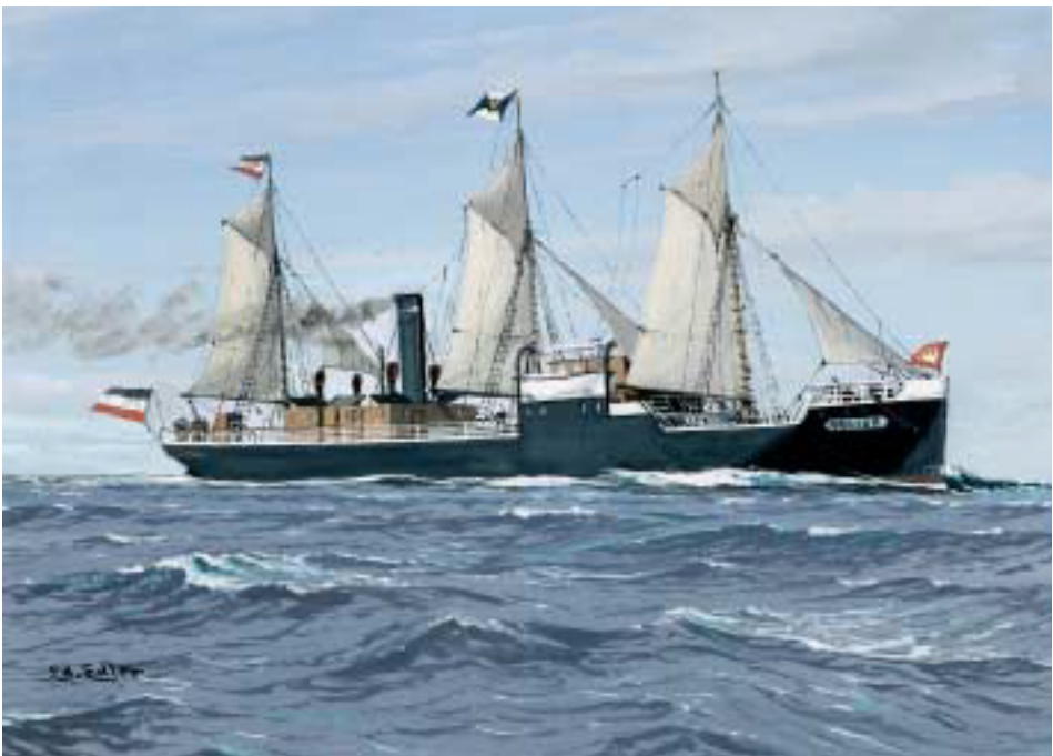
Dampfer VULCAN. Gouache von Eduard Edler. (Deutsches Schifffahrtsmuseum)