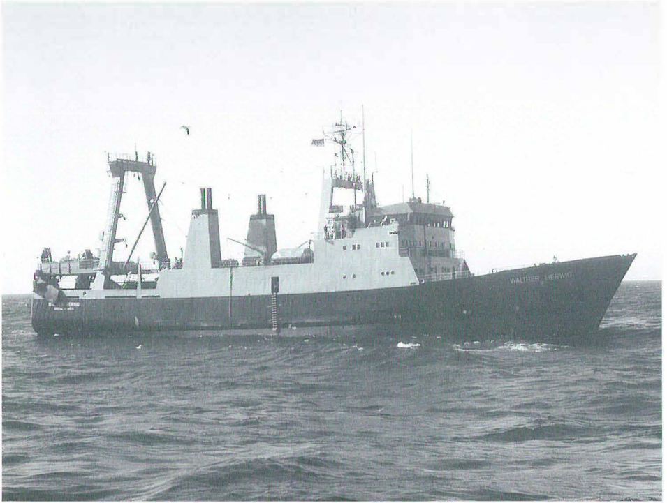
Abb. 6 Fischereiforschungsschiff WALTER HERWIG (II), 1973 bis 1994, 1986 in der Nordsee.