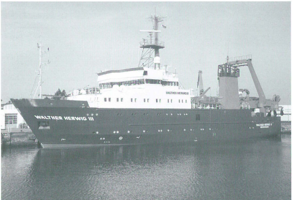
Abb. 7 Fischereiforschungsschiff WALTER HERWIG III, seit 1994.