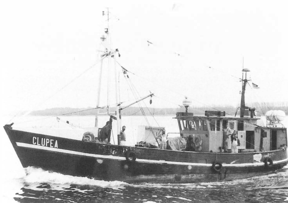
Abb. 9 Fischereiforschungskutter CLUPEA, gebaut 1949, seit 1992 im Dienst des BML.