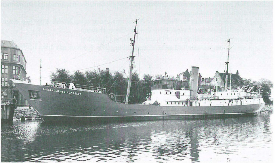
Abb. 3 Fischereiforschungsdampfer ALEXANDER VON HUMBOLDT, 1940.

der Deutschen Meere im Interesse der Fischerei in Kiel (gegr. 1870) aufbauen: Deren leitende Wissenschaftler waren bzw. wurden Mitglieder der Kommission, die Mitarbeiter führten mit ihren Kenntnissen und Geräten die Forschungsarbeiten durch. Aus den bis dato gemachten Erfahrungen, daß Handels- und Kriegsschiffe selbst nach Umrüsten nur bedingt als Forschungsschiffe taugten, entstand für die ›Internationale Meereskunde‹ der erste Neubau eines hochseegehenden reinen Forschungsschiffes unter deutscher Flagge: Der Reichsforschungsdampfer (RFD) POSEIDON kam im Mai 1902 in Fahrt und wurde, wie die übrigen Mittel für die DWK, in die Verwaltung des DSV gegeben (ein für heutige Haushälter nur schwer nachvollziehbarer Vorgang). Das Schiff war in der Form der damals modernsten Seitenfänger so durchdacht gebaut, daß es bis 1939 seinen Dienst im Aufgabenbereich der ›Internationalen Meeresforschung‹ in Nord- und Ostsee versah. Selbstverständlich konnte es nicht alle der sich erweiternden Arbeits- und Themengebiete der Fischereiforschung abdecken. Ab Mitte der zwanziger Jahre nahm auch die DWK vermehrt andere Schiffe für ihre Arbeiten in Anspruch. Der Ersatzbau für POSEIDON, die ALEXANDER VON HUMBOLDT, wurde zwar 1940 noch als Fischereiforschungsschiff fertiggestellt, doch anschließend sofort zum Lazarettsschiff umgerüstet.