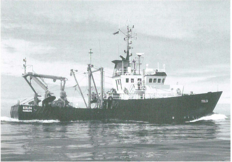
Abb. 8 Fischereiforschungskutter SOLEA, seit 1974, hier 1996 in der Ostsee.

schungslandschaft von Seiten des BML Rechnung getragen und die DWK als haus- und regierungseigenes Beratungsgremium und als Koordinierungsinstrument fischerei- und umweltrelevanter Forschungsvorhaben installiert.