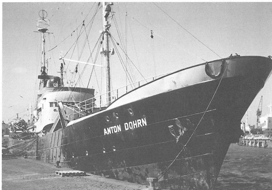
Abb. 4 Fischereiforschungsschiff ANTON DOHRN (I), 1955 bis 1973, am Liegeplatz in Bremerhaven.