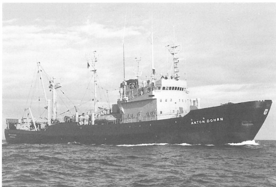
Abb. 5 Fischereiforschungsschiff ANTON DOHRN (II), 1973 bis 1986, ex WALTHER HERWIG (I), 1963 bis 1973.