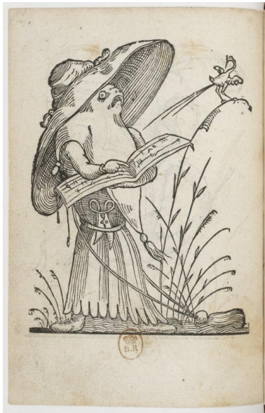
Ил. 1. Страница из „Юмористические мечты Пантагрюэля“ (1565)

„Кодекс Серафини“ ( Codex Seraphinianus ). Эту бессловесную книгу мировой известности часто определяют как мистериозную визуальную книгу незнакомой письменности. Ее сотворил итальянский архитектор и графический дизайнер Луиджи Серафини (Luigi Serafini). Он сдал ее в издательство Franco Maria Ricci в 1978 г. (ил. 3) [17]. Автор сам придумывает странную (и сознательно нечитаемую) книгу, наполненную странными рисунками в стиле руководства с инструкциями о внеземной цивилизации. Но очевидным образом там можно заметить имитации легендарной неразгаданной книги „Рукопись Войнича“ („Voynich manuscript“). Вопреки тому, что написанное в ней есть полная бессмыслица в стиле Lorem Ipsum, несколько исследователей обнаружили, что нумерирование страниц следует за твердой, „идиосинкратичной“ схемой на основе 21 различных исключений. Истина такова – богато раскрашенный текст Серафини просто игровая шутка, оформленная стилем внеземного зашифрованного текста (сiphertext). Реально она не предназначена к чтению, но с первого своего издания и до сегодняшнего дня к ней проявлен не только огромный торговый, но и научный интерес.