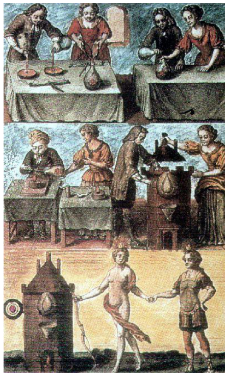
Ил. 2. Страница из „Mutus Liber“ (1677)