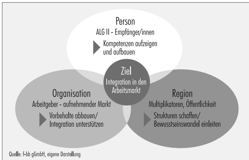
Abb. 2: Integrationsstrategie im Pakt50 auf drei Ebenen

940 Personen aktiviert und eine Vermittlungsquote 3 von 21 Prozent erreichen können. Förderleistungen an Unternehmen sind kaum bis gar nicht gezahlt worden. Dies kann im Hinblick auf die vorliegenden Vermittlungshemmnisse der Zielgruppe sowie im Vergleich zu anderen Instrumenten für ältere Langzeitarbeitslose als erfolgreich bewertet werden.