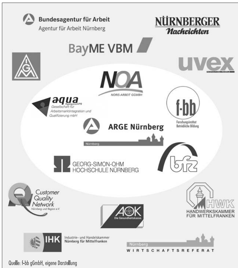
Abb. 3: Kooperationspartner im „Pakt50 für Nürnberg“ (Kernpartner und Unterstützer)