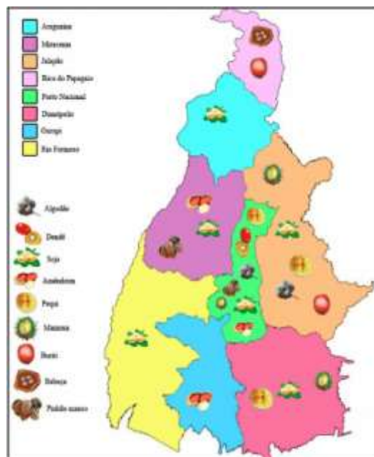
Figure 3: Distribution of oil in the state of Tocantins.