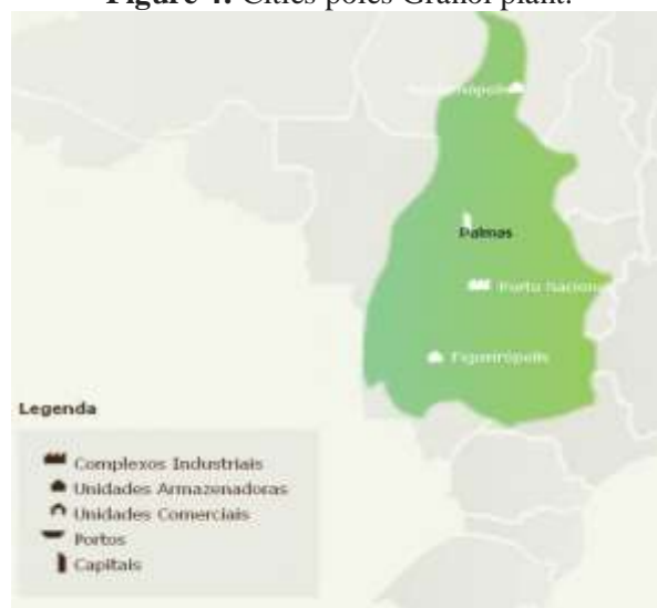
Figure 4: Cities poles Granol plant.