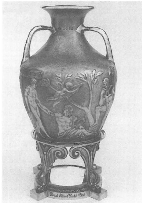
Abb. 4: Silberner Regattapreis, gewonnen von der Yacht METEOR (I) 1894.