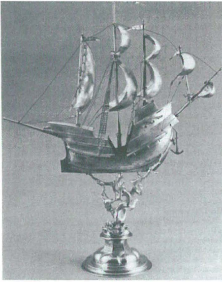
Abb. 5 Versilberter Regattapreis in Form einer Kavacke, im Wettsegeln mit der Yacht METEOR (III) gewonnen von der Yacht HAMBURG 1905.

Ein silberner Münzhumpen (Abb. 3) wurde als Regattapreis 1894 von der Kieler Goldschmiedefirma Heinrich Hansen angefertigt. Anlässlich der Regatten besuchte Wilhelm II. den Inhaber gerne, dem Prinz Heinrich, der Bruder des Kaisers, 1888 den Titel »Königlicher und Kaiserlicher Hoflieferant« verliehen hatte. 8 Der zylindrische Humpen mit breitem Standring, hoch aufgewölbtem Deckel und einfachem Henkel ist in Aufbau, den steilen Proportionen und der dichten Rankenornamentik englischen Kannen aus der Mitte des 17. Jahrhunderts nachgebildet. 9 Die vierpaßartig angeordneten Münzen zeigen preussische Könige und deutsche Kaiser. Die Inschrift lautet oben am Corpus: Regatta-Preis Segel-Wettfahrt Kiel-Travemünde 29. Juni 1894 und auf dem Griff: Kaiserl. Yacht-Club + norddt. Regatta-Verein gewonnen von Seiner Majestät des Kaisers u. Königs Yacht METEOR . Wir haben allen Grund zu der Annahme, daß diese Siegestrophäe auch auf der siegreichen Yacht METEOR (I) zur Schau gestellt und auf die sie ablösenden gleichnamigen Yachten übernommen wurde.