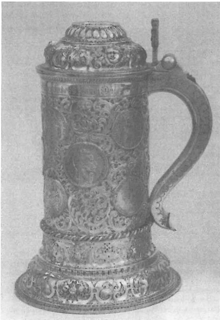
Abb. 3: Silberner Münzhumpen als Regattapreis, gewonnen von der Yacht METEOR (II) 1896. (Aus: Kaiserlicher Kunstbesitz ..., 1991)

Zu den in den Wandschränken seiner Yachten ausgestellten Goldschmiedearbeiten hatte er so persönliche Beziehungen, daß er sich auch davon ausgewählte Stücke in sein Exil schicken ließ, bevor die Schiffe verkauft wurden. 7 So blieben diese Objekte zwar in Doorn erhalten; da aber die vorhandenen Unterlagen keine ausreichenden Angaben zu den ursprünglichen Standorten machen, lassen sich die Silberarbeiten aus den Yachten nur dann klar von denen aus den Schlössern trennen, wenn Inschriften auf den Stücken sie als Trophäen der Yachten ausweisen. Das ist der Fall bei folgenden Regattapreisen: