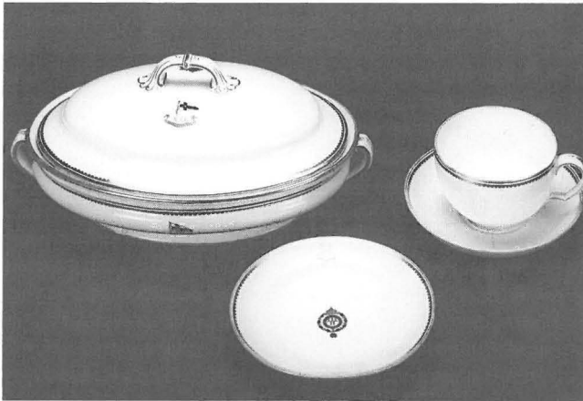
Abb. 1 Bordgeschirr der kaiserlichen Yachten: ovale Deckelschüssel der Segelyacht IDUNA, kleiner Teller und Suppentasse der Dampfyacht HOHENZOLLERN.

Der Gesamteindruck von den Räumlichkeiten an Bord wurde für die Yachtgäste des Kaisers nicht nur durch den Raumzuschnitt und die Möblierung bestimmt, sondern auch durch das Tafelgeschirr, von dem sie ihre Mahlzeiten einnahmen, und durch die Segeltrophäen, die sie hinter den Glastüren in den Wandschränken des Salons sahen und deren Geschichten der Eigner sicher gerne erzählte. Während wir die Möbel und die übrige Ausstattung der Kaiseryachten nur aus Zeichnungen und Fotos kennen, die auch einige Blumenvasen und silberne Pokale zeigen 1 , sind wenigstens Teile des Bordgeschirrs und einige Regattapreise im Original erhalten geblieben. Wir können diese also durch unmittelbare Anschauung beurteilen.