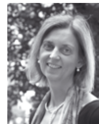
Prof. Dr. Bärbel Fürstenau lehrt Wirtschaftspädagogik an der TU Dresden.

Unter Concept Maps versteht man zweidimensionale Strukturdarstellungen von Wissen oder Informationen in Form eines Netzwerkes. Der Beitrag erläutert das Prinzip Concept Map, auch in Relation zur Mind Map, und fasst Ergebnisse der Lern-Lern-Forschung zu deren Einsatz zusammen. Die Leser/innen erfahren, zu welchen Zwecken Concept Maps eingesetzt werden können (z.B. Wissensdiagnostik), wie ihre Lernwirksamkeit eingeschätzt wird und welche Faktoren diese erhöhen können.