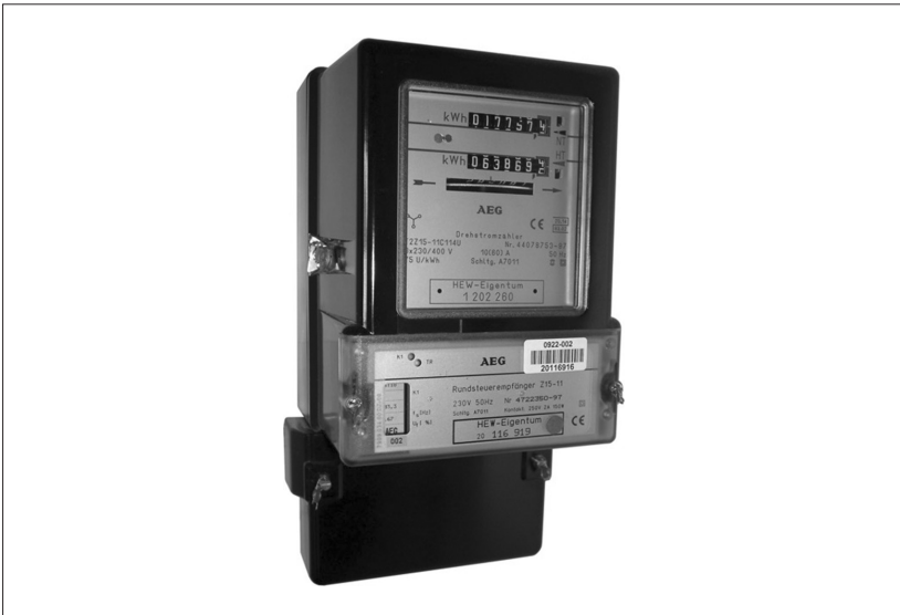
Abbildung 2: Zweitarifzähler mit Rundfunksteuerempfänger für Tag- und-Nacht-Tarif.

truhen, Nachtzeit bei Geschirrspütern und Wäschetrocknern) flexibel dazu, zudem können Elektrofahrzeuge mit hoher Batteriekapazität genau dann geladen werden, wenn die Nachfrage anderer Verbraucher sinkt, um eine stabile Nachfrage nach elektrischer Energie zu erzielen. Die Steuerung von „Stromfressern“ wie Nachtspeicherheizungen und Wärmepumpen durch ein intelligentes Stromnetz ergänzt das Konzept eines selbst-stabilisierenden Netzes (Smart Grid) über die Einbeziehung elektrischer Verbraucher.