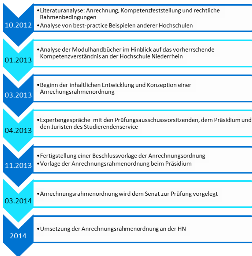
Abb. 3: Vorgehen der Hochschule Niederrhein (HN) bei der Erarbeitung einer hochschulweiten Anrechnungsrahmenordnung