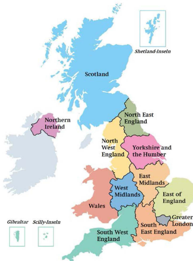
Abbildung 2 Die administrative Gliederung des Vereinigten Königreichs