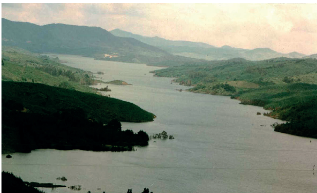
Embalse 1

Un estudio de agosto de 1978 titulado “Aprovechamiento múltiple del Rio grande”, de Empresas Públicas de Medellín, sugería en su numeral IV, qué se debería hacer para el reordenamiento de la cuenca y la adquisición de tierras para proteger el agua y la calidad de la misma que va hacia el embalse, y el embalse mismo. Es así que se definen las áreas de construcción y las áreas críticas. Ambas, dice el documento, deben adquirirse por EPM, en virtud de proteger el ciclo del agua; definiéndose los instrumentos legales y los procedimientos para la adquisición de dichos bienes.