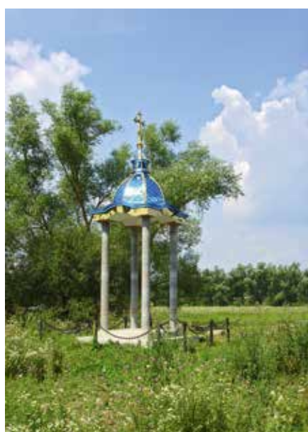
Fotos 8 und 9: Kreuz und Kapelle der Ukrainisch-Orthodoxen Kirche Moskauer Patriarchats