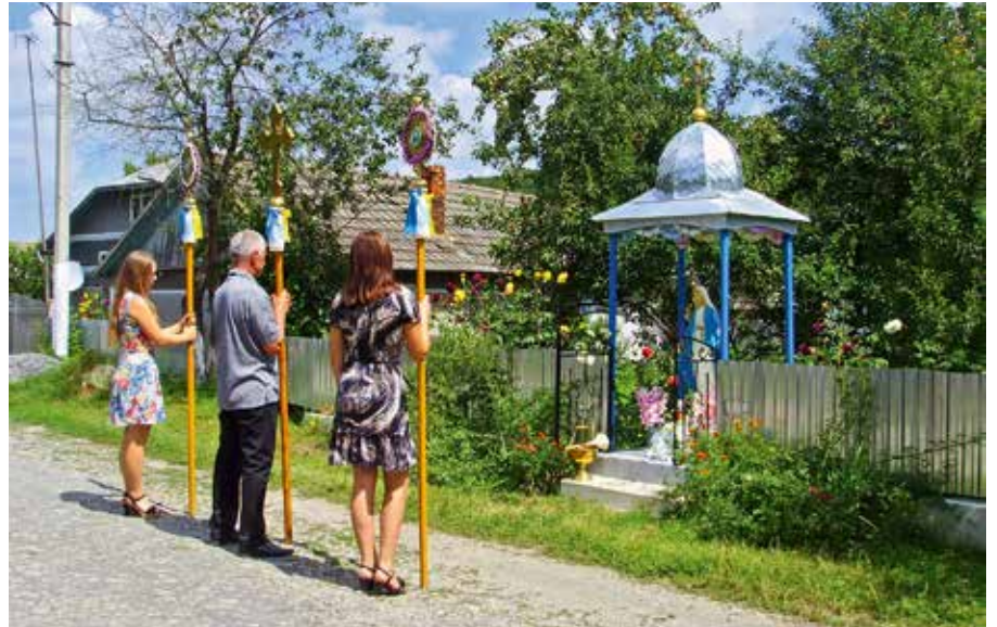
Fotos 10 und 11: Kapellen der Ukrainischen Griechisch-Katholischen Kirche

worden bin? Von wegen, ich wollte die ganze Zeit essen, alles, was den Magen füllt, aber satt war ich nicht ...“ (Zeitzeugenbericht 2, geboren 1917, aufgezeichnet 12.9.2007).