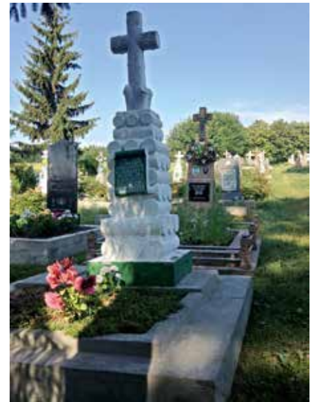
Fotos 14 bis 16: Grab des polnischen Grundbesitzers, Grab der UPA-Kämpfer, Grab des polnischen Arztes und seiner Familie

gemeinschaftliche Modelle hatten hier eine gewisse Tradition. Der erste freiwillige Zusammenschluss von Bauern hatte sich bereits 1922 gegründet und wurde 1930 in eine Kolchose umgewandelt, die dann ab 1931 Kern für die Kollektivierung war. Diese wird von vielen als problematisch erinnert, insbesondere wegen der Willkür des Vorgehens und des Verlustes von Land bei jenen, die Besitz hatten (Gespräch mit Dorfbewohnern 2013).