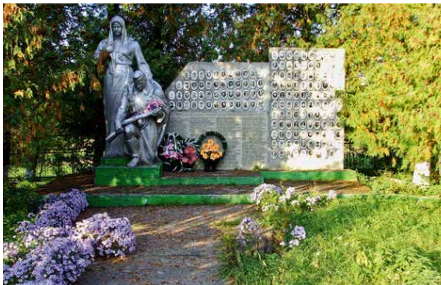
Fotos 6 und 7: Denkmal für die Gefallenen des Großen Vaterländischen Krieges, Denkmal für die Toten der Hungersnot von 1932/33 und die Opfer von Repressionen in der Sowjetzeit

auch im Zusammenhang mit Ereignissen, die sie repräsentieren und wo diese Ereignisse stattgefunden haben oder auch nicht stattgefunden haben.