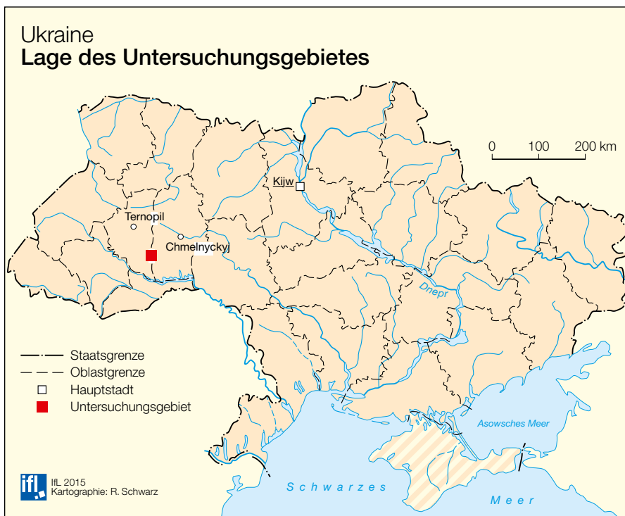
Abb. 1: Lage des Untersuchungsgebietes

Grenzen und den damit verbundenen historisch hergeleiteten kulturellen Regionen wird hier eine solche Phantomgrenze, die zwischen dem historischen Ostgalizien (ehemals Österreich-Ungarn) und der Zentralukraine (ehemals Russland)