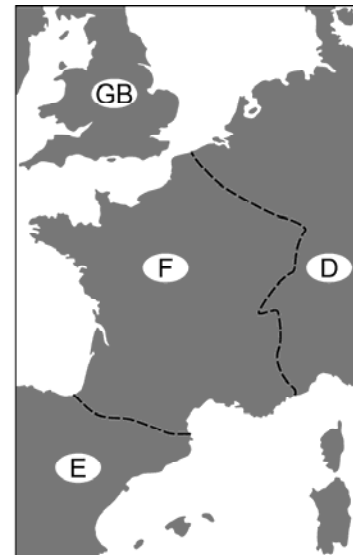
Abb. 2: Räumliche Kategorisierung

Um diesen Fragen nachzugehen, seien hier grundlegende Kennzeichen von Kultur, die im Kulturvergleich eine Rolle spielen, kurz rekapituliert: