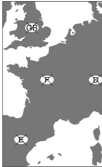
Abb. 3: Kultur ohne Kennzeichnung

Die Möglichkeiten zu alternativen Gruppierungen zu gelangen, müssen sich auch in semantischer Hinsicht auf jene Angebote beschränken, die ohne den Raum auskommen. Vergleiche ohne nationale oder regionale Attributierungen sind in ihrer Abstraktion jedoch schwer vorstellbar (Abb. 3).