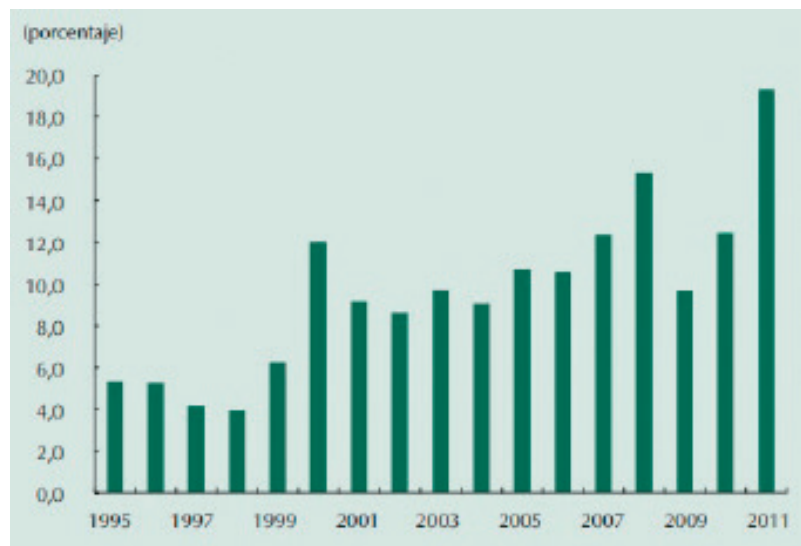
Gráfica No. 4 Ingresos por la actividad petrolera como porcentaje de los ingresos corrientes del GNC9

El Marco Fiscal de Mediano Plazo diseñado por el Ministerio