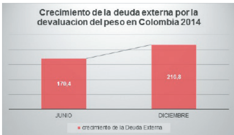
Gráfica No. 5 Crecimiento de la deuda externa por la devaluación en Colombia en billones de pesos 2014 15 Tomado de: Banco de la República (2014)

24hGold. (2014). Historical Trend for WTI CRUDE. Recuperado de: http://www.24hgold.com/english/interactive_chart.aspx?codecom=wti%20crude%20future&title=WTI%20Oil