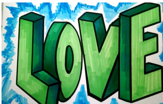
Рис. 6. Граффити в стиле 3D

Стиль character (англ. «характер»), на ряду с wild style довольно сложен для исполнения, так как рисунки стиля character выполняются с использованием большого количества цветов (не менее 5), в связи с чем, в данном стиле чаще всего работают опытные writer'ы, которые к тому же имеют ярко выраженные художественные способности. Представленные ранее стили граффити относятся к шрифтовому направлению, тогда как стиль character есть сочетание шрифтового и сюжетного направлений (или чисто сюжетные рисунки). Character отличается ото всех рассмотренных выше стилей тем, что это не только изображение слов, но и создание рисунков, как правило, карикатур или комиксов. По этой причине граффити данного стиля содержат типичную для комиксов рамку с речью изображенного, обычно вымышленного, персонажа.