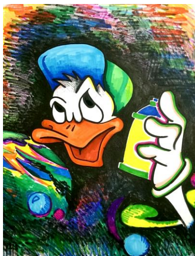
Рис. 7. Граффити в стиле character

Стиль character (англ. «характер»), на ряду с wild style довольно сложен для исполнения, так как рисунки стиля character выполняются с использованием большого количества цветов (не менее 5), в связи с чем, в данном стиле чаще всего работают опытные writer'ы, которые к тому же имеют ярко выраженные художественные способности. Представленные ранее стили граффити относятся к шрифтовому направлению, тогда как стиль character есть сочетание шрифтового и сюжетного направлений (или чисто сюжетные рисунки). Character отличается ото всех рассмотренных выше стилей тем, что это не только изображение слов, но и создание рисунков, как правило, карикатур или комиксов. По этой причине граффити данного стиля содержат типичную для комиксов рамку с речью изображенного, обычно вымышленного, персонажа.