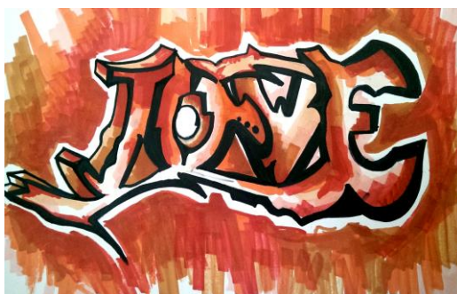
Рис. 5. Граффити в стиле wild style

Отличительной чертой стиля wild style (англ. «дикий стиль») является использование широкой палитры цветов и оттенков при создании рисунка. Кроме того, writer'ы, работающие в данном стиле, обычно прибегают к написанию букв различных форм, введением стрелок и других усложняющих элементов. Все это приводит к тому, что слова, написанные стилем wild style, трудно читаемы. Данный стиль граффити прямо противоположен стилю новичков bubble и является своеобразной вершиной мастерства writer'a, так как важным здесь является не только умение правильно подбирать контуры, но и способность грамотно смешивать цвета.