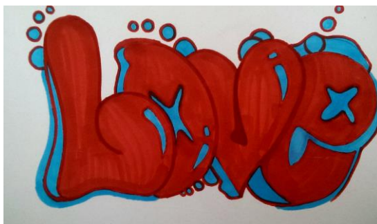
Рис. 3. Граффити в стиле bubble

Название стиля Broadway восходит к названию самой длинной (свыше 25 км) улицы г. Нью-Йорка. Рисунки граффити, выполненные в данном стиле, реализованы в 2 цветах. Данный стиль граффити характеризуется принципом «чем имя больше – тот круче», в связи с чем, важным становится размер надписи.