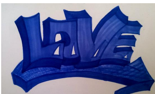
Рис. 4. Граффити в стиле Broadway

Название стиля Broadway восходит к названию самой длинной (свыше 25 км) улицы г. Нью-Йорка. Рисунки граффити, выполненные в данном стиле, реализованы в 2 цветах. Данный стиль граффити характеризуется принципом «чем имя больше – тот круче», в связи с чем, важным становится размер надписи.