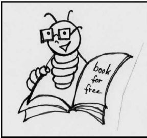
Buddie – der Bücherwurm von budrich academic

Füttere Buddie mit Deiner Buchbesprechung!