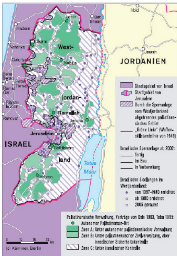
Abbildung 1: Westjordanland im Februar 2008