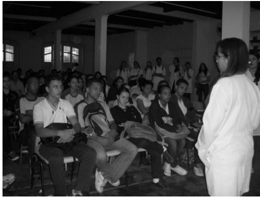
Imagem 2 - Acadêmica do 3º período de Enfermagem atenta à pergunta que esta sendo feita pelo aluno do 3º ano do Ensino Médio