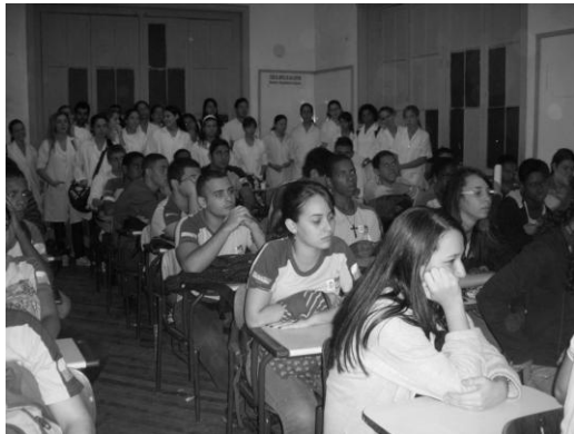
Imagem 3 - Em outro ângulo, alunos da turma do 3º Ano do Colégio Olinto. Ao fundo, Acadêmicos de Enfermagem da UNIRIO