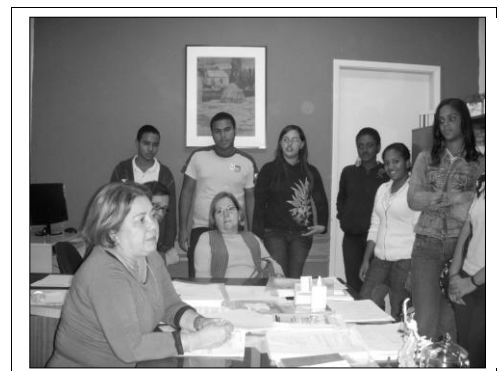
Imagem 1 - Apresentação sobre a Universidade e a EEAP, na Sala da Direção da EEAP

Destacamos algumas imagens que representam os três encontros para ter uma ideia geral.