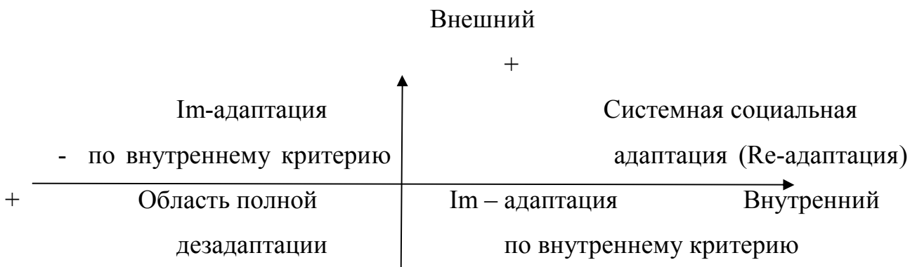
Рис. 1. Адаптация по А.А.Реан

А.А.Реан систематизируя итоговые результаты адаптации, выделяет двухмерную классификация (рис.1), где в качестве ортогональных измерений модели социальной адаптации предлагается соответствия реального поведения человека требованиям социального окружения («внешний критерий»), а так же отсутствие ощущения угрозы достижения внутриличностной комфортности («внутренний критерий») [16].