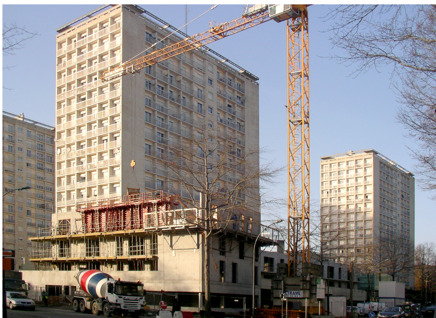
Foto 8: Wohnraummangel in Villejean – Baustelle vor den HLM der dalle