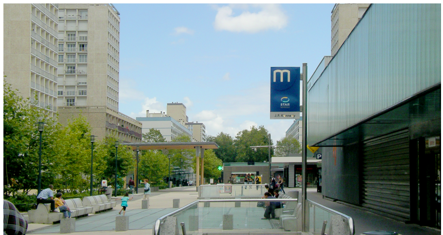
Foto 2: Zentraler Platz dalle Kennedy auf der Ost-West-Achse mit der Metrostation Foto: Bopp 2009

Quelle: I-VILLE, base documentaire (Hrsg.): http://i.ville.gouv.fr/document/list?title=ZRU+Villejean&author=&document_type_id=17&topic_id=&plan_id=&zone_code=&searchText=&commit=Lancer+la+recherche&date_month=0&date_year=1997&filters[sort]=&searchType=1 (letzter Zugriff 21.07.2011)