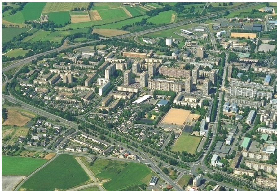
Foto1: Luftbild der ZUP Villejean

Die Herausforderung Rennes' liegt heute darin, politische Entscheidungen auf die 140 Kommunen umfassende Gesamttagglomeration abzustimmen. Bei der Verteilung neuen Wohnraums etwa soll dieser gleichmäßig auf die Agglomeration verteilt werden, ohne die landwirtschaftlich genutzte Zone der Umgebung zu gefährden