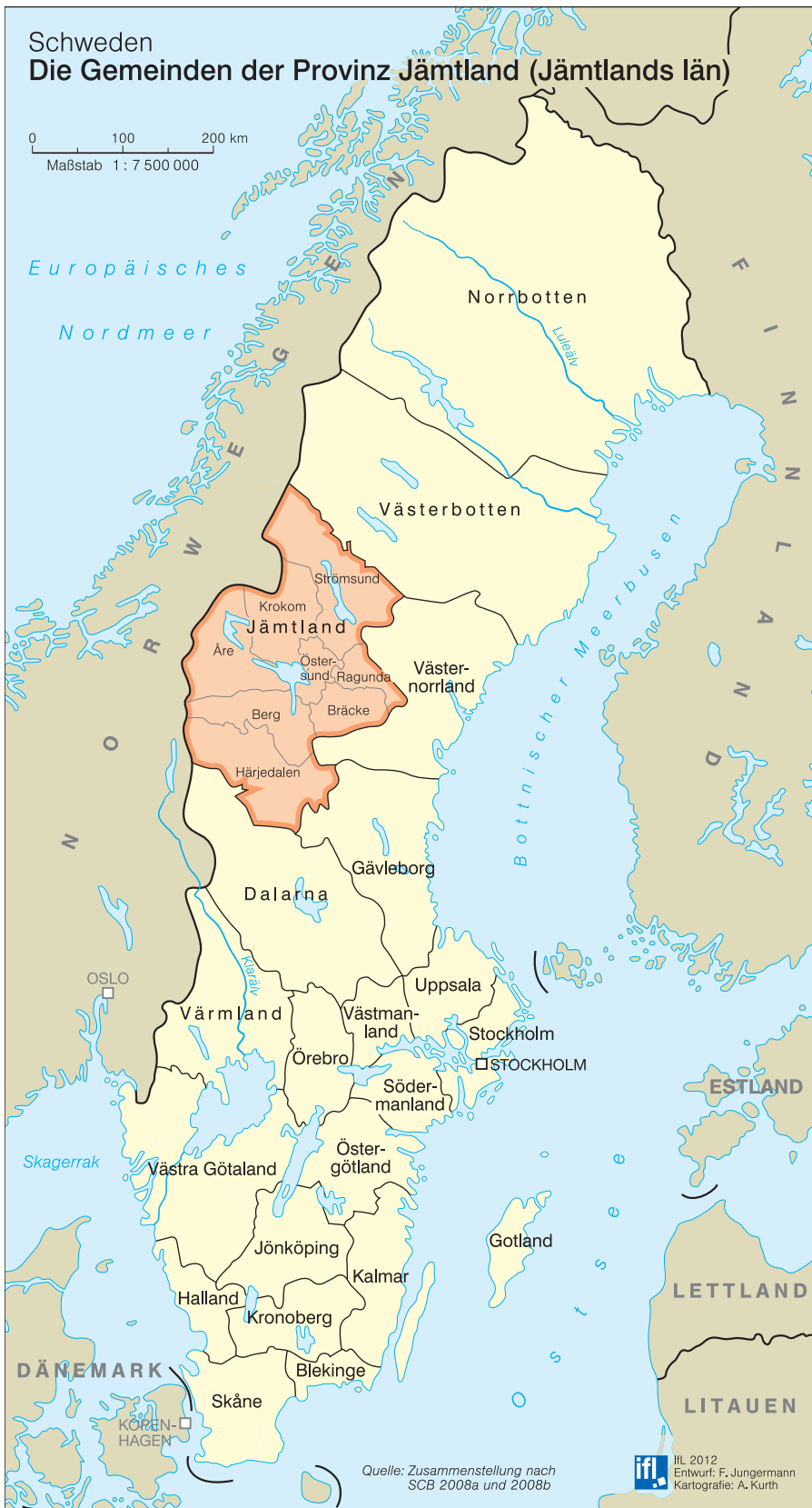
Abb. 3: Die Gemeinden der Provinz Jämtland