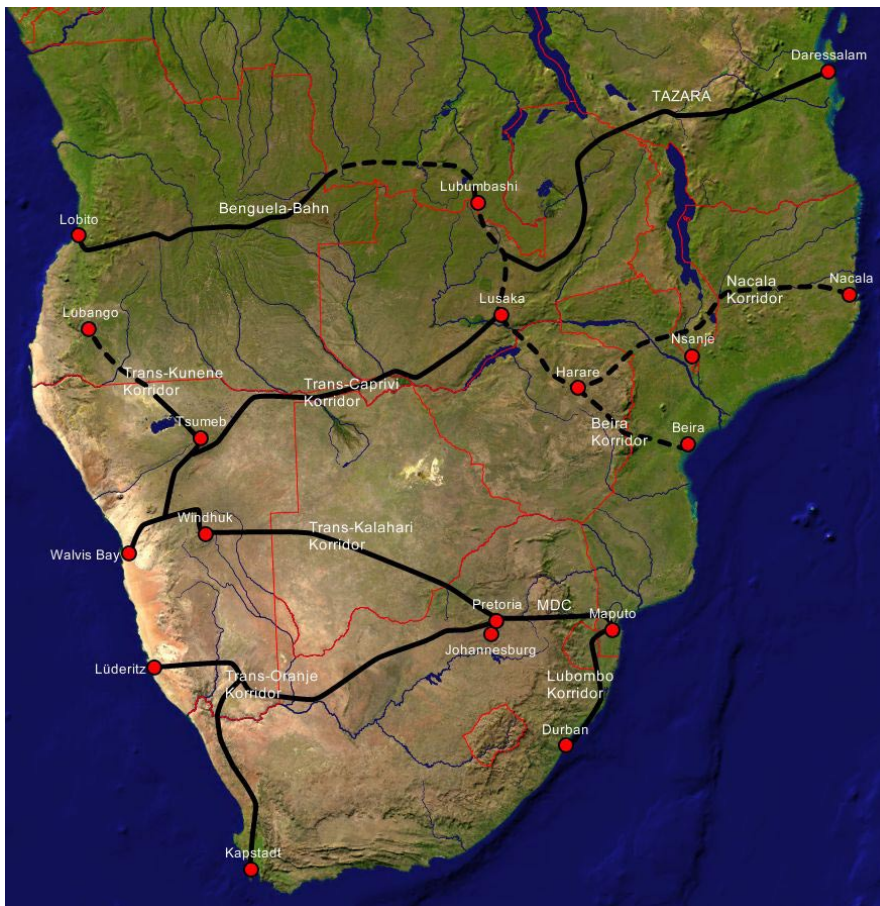
Karte 1: Transportkorridore im südlichen Afrika

Umsetzung: Sören Scholvin auf der Basis von MapCreator