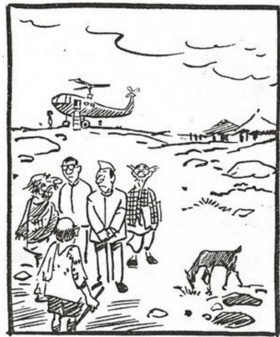
Abbildung 1: Cartoon von R. K. Laxman

No, sir, this is neither a flood-hit nor a drought-hit area. We are only hit by bad government!