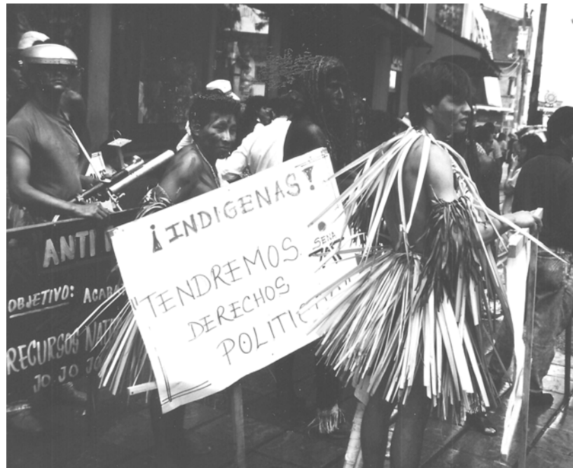
Abb. 4: Gemeinsamer Protest für die politischen Rechte der „Ethnischen Minderheiten“ in Villavicencio (departamento Meta).

den Gemeinschaften zur Aufklärung von Verbrechen, wie dem gewaltsamen Verschwindenlassen von indígenas, wenn die staatlichen Institutionen dieser Aufgabe nicht nachkommen. Die indígenas richten zudem spezielle Rückzugsgebiete für Vertriebene und spezielle Zonen ein, in denen unterschiedliche Bevölkerungsgruppen zusammenleben, um gemeinsam eine Antwort auf den Konflikt zu suchen (Territorios de Convivencia). 51 Auch die Gründung neuer politischer Organisationen (wie die Alianza Social Indígena, ASI, und das Movimiento Autoridades Indígenas de Colombia, AICO) bieten eine Chance, zur friedlichen Konfliktbearbeitung beizutragen, und haben durch das besondere Politikverständnis der indígenas Modellcharakter 52 . Als ein weiteres Mittel, dem Konflikt zu begegnen, suchten die indígenas den Zusammenschluss mit anderen sozialen Gruppen (Bauern, Afrokolumbianern, Comuneros und Gewerkschaftern) in so genannten movilizaciones masivas. Sie haben eine wichtige Führungsfunktion bei der Mobilisierung zu Streiks und Blockaden gespielt, um gemeinsam mit anderen sozialen Gruppen für ihre Rechte einzutreten, die eine Art „Schule der Demokratie“ sein könnten. Zudem schützen gemeinsame Aktionen die Beteiligten durch ihren kooperativen Charakter und erhöhen deren Schlagkraft.