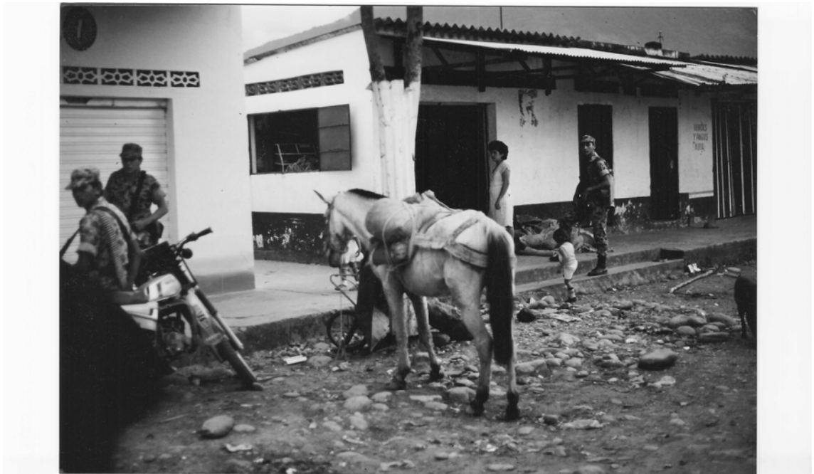
Abb. 2: Militärpräsenz ist in Kleinstädten und Dörfern keine Seltenheit. In den Konfliktregionen haben die Militärs oft Sonderrechte und übernehmen die Funktion von Bürgermeistern. Rechtsstaat und Demokratie bleiben dabei auf der Strecke.

Zentrales Anliegen der Regierung Uribe ist die Erhöhung staatlicher Kontrolle und die vor allem sicherheitspolitische Stärkung des kolumbianischen Staates. Andere staatliche Funktionen, wie die Verteilungs- und Gerechtigkeitsfunktionen oder die Verbesserung der Verwaltungsfunktion mit dem Ziel der good governance traten zunächst in den Hintergrund. Das wichtigste Instrument der Regierung hierbei ist die „Politik der demokratischen Sicherheit“, die den Einfluss der Guerilla reduzieren helfen soll. Die staatlichen Sicherheitskräfte wollen dadurch die territoriale Kontrolle über die von der Guerilla dominierten Gebiete zurückgewinnen.