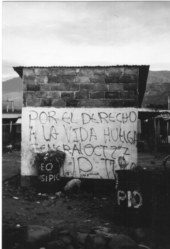
Abb. 3: „Für das Recht auf Leben, Generalstreik, 27. Oktober“: Seit Jahren setzen sich „Oppositionsparteien“ für die Öffnung des politischen Systems ein – und zahlen einen hohen Preis: So verloren bereits an die 3000 Mitglieder der Partei Unión Patriótica (UP) ihr Leben im Kampf für mehr Gerechtigkeit.

Für die Entwicklung von Strategien zur Verringerung und Beendigung der Gewalt ist es deshalb notwendig, nach Gewinnern und Verlierern von Krieg und Frieden zu fragen. 30 Für welche Akteure und gesellschaftlichen Gruppen ist der Krieg profitabler als der Frieden? Wer kann von einer Reduzierung der Gewalt profitieren? Wie können Anreize geschaffen werden, um das Kräfteverhältnis zugunsten möglicher Friedensakteure zu beeinflussen und so zur Bildung von Friedensallianzen (constituencies) 31 beizutragen?