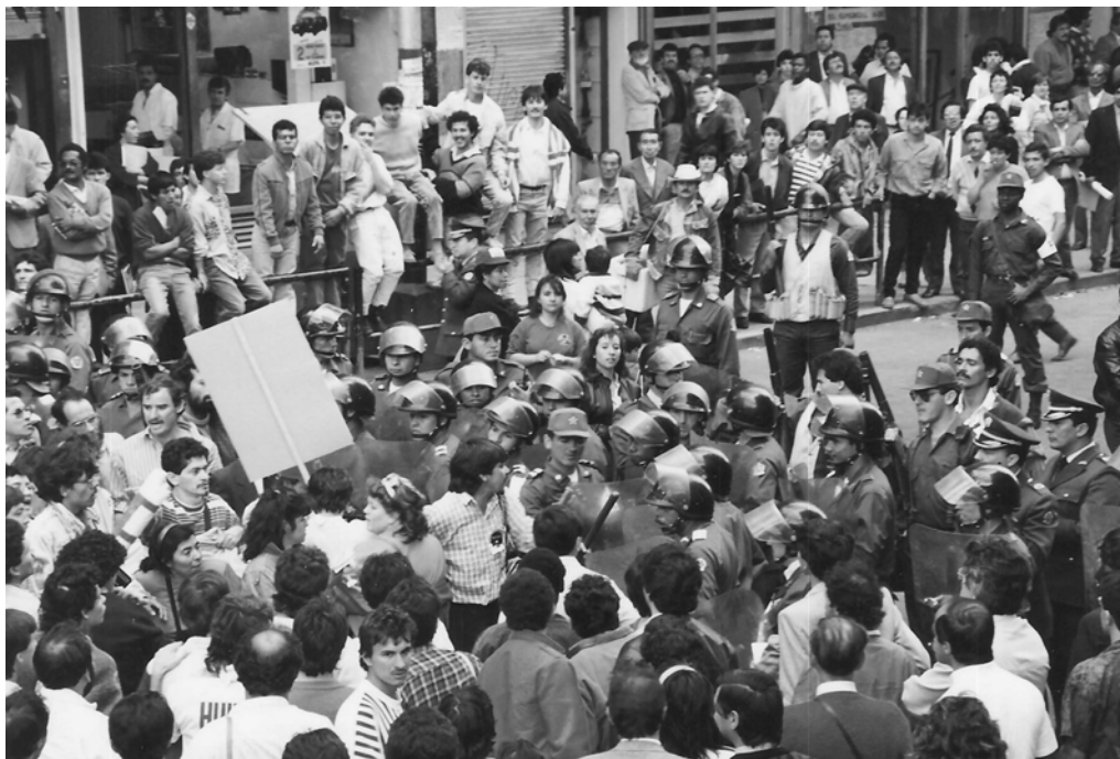
Abb. 1: „Bis hierher und nicht weiter!“ Soziale Bewegungen – wie die Gewerkschaften hier bei einer Demonstration gegen die Privatisierung staatlicher Betriebe in Bogotá – scheuen die Konfrontation mit dem Staat nicht.

Im Folgenden sollen die damit zusammenhängenden Fragen im Rahmen der aktuellen Debatten um Krieg und Frieden analysiert werden, wobei die spezifischen Charakteristika der der Gewalt zugrunde liegenden Strukturen, deren politische und kulturelle Manifestationen sowie der verschiedenen internen und externen Akteure in das Zentrum der Analyse gestellt werden. Schon aufgrund der großen Komplexität wird es keinen „Königsweg“ zur Gewaltreduzierung geben. Allerdings lassen sich sehr wohl Elemente benennen, die eine Strategie zur Verringerung der Gewalt integrieren muss.