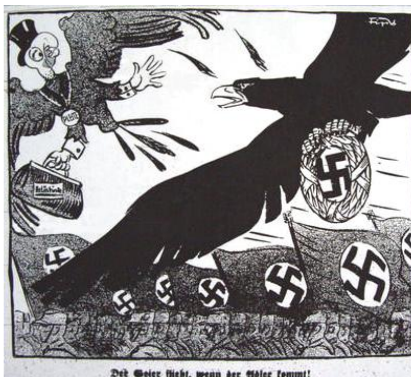
FIGURA 1 – FIPV. Der Geier flieht, wenn der Adler kommt! 2

Localizada temporalmente na primeira fase da publicação e do movimento nazista, a charge abaixo é, antes de tudo, um exemplo do caráter antissemita e persecutório do semanário. A reconstrução de seus sentidos revela as estruturas e as disposições que permeiam e definem a sociedade em que ela foi produzida.