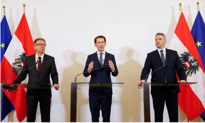
Fig. 1: Der österreichische Bundeskanzler Sebastian Kurz, Innenminister Karl Nehammer und Gesundheitsminister Rudolf Anschober richten sich an die Medien in Wien, Österreich, 13. März 2020.

Rationalität und Emotionalität werden bei Weber mithin radikal vergeschlechtlicht. Politik erscheint als rationales Feld, als Beruf von und unter Männern, in dem Frauen ebenso wenig Platz finden wie Emotionen, die von Weber mit Weiblichkeit in Verbindung gebracht und diskreditiert werden.