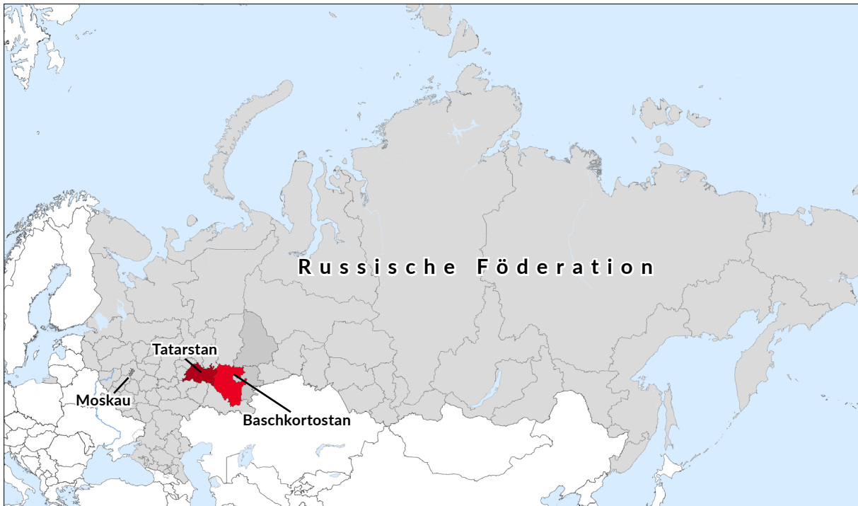
Karte 1: Baschkortostan und Tatarstan