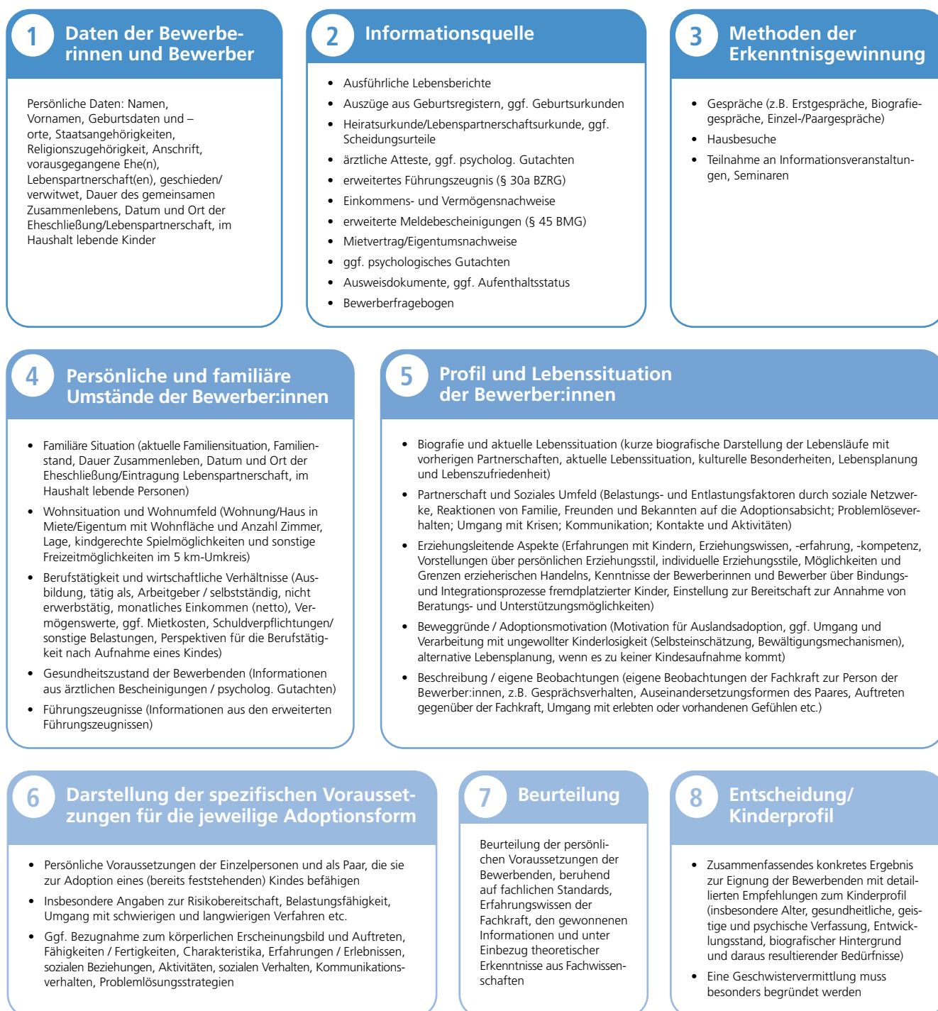
Abbildung 2: Hilfestellung zur Erstellung von Teil I des Sozialberichts

Die BAG Landesjugendämter (2022) verweist darauf, dass der Bericht in einer einfachen und klar strukturierten Sprache verfasst werden sollte, um die erforderliche Übersetzung zu erleichtern. Es gilt außerdem zu beachten, dass einige Herkunftsstaaten bestimmte Vorgaben zum Aufbau und Inhalt des Berichts stellen.