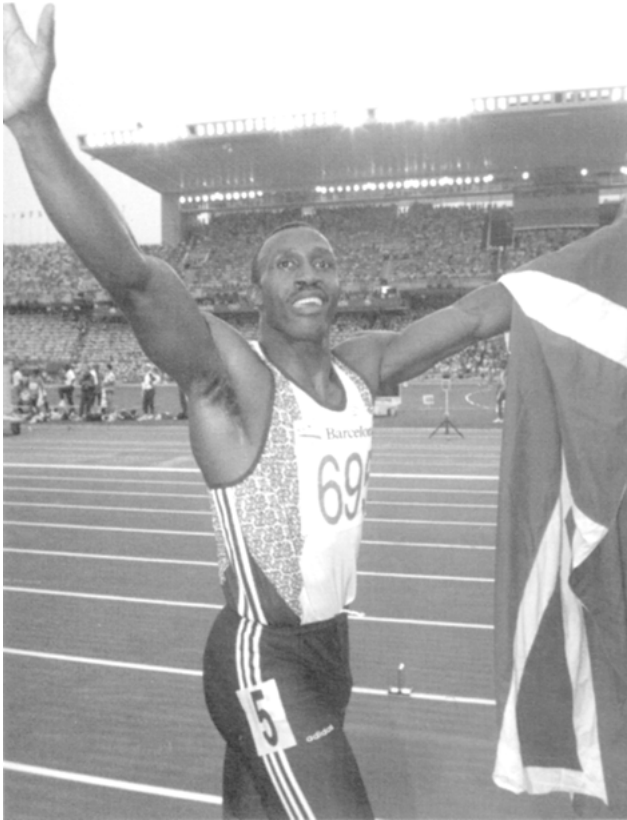
Pressefoto (Allsport) Quelle: (Hall 1997e: 229)

Von den Vorannahmen der Betrachter hängt es ab, welcher Bedeutung der Vorzug gegeben wird, wobei der/die Betrachtende laut Hall