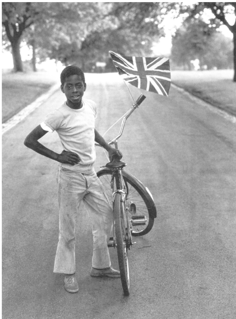
Vanley Burke: Boy with Flag (1977) (Hall/Sealy 2001: 32)

Im Laufe der 80er Jahre kamen andere Formen der künstlerischen Repräsentation dazu. „There was a greater recognition of the internal complexities of their situation by black and other non western artists, in whose lived experience several axes of difference – race, gender, class, sexuality and ethnicity – now overlapped“ (Hall/Sealy 2001: 15). Die folgende Einschätzung Halls zum Selbstbewusstsein dieser neuen Generation bezieht sich nicht ausdrücklich nur auf Künstler: „Junge schwarze