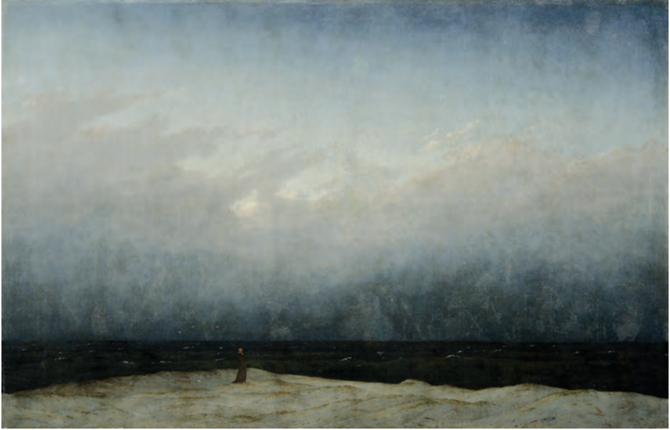
Abb. 1 Caspar David Friedrich, Gemälde »Mönch am Meer«, Vorzustand vor der Restaurierung.