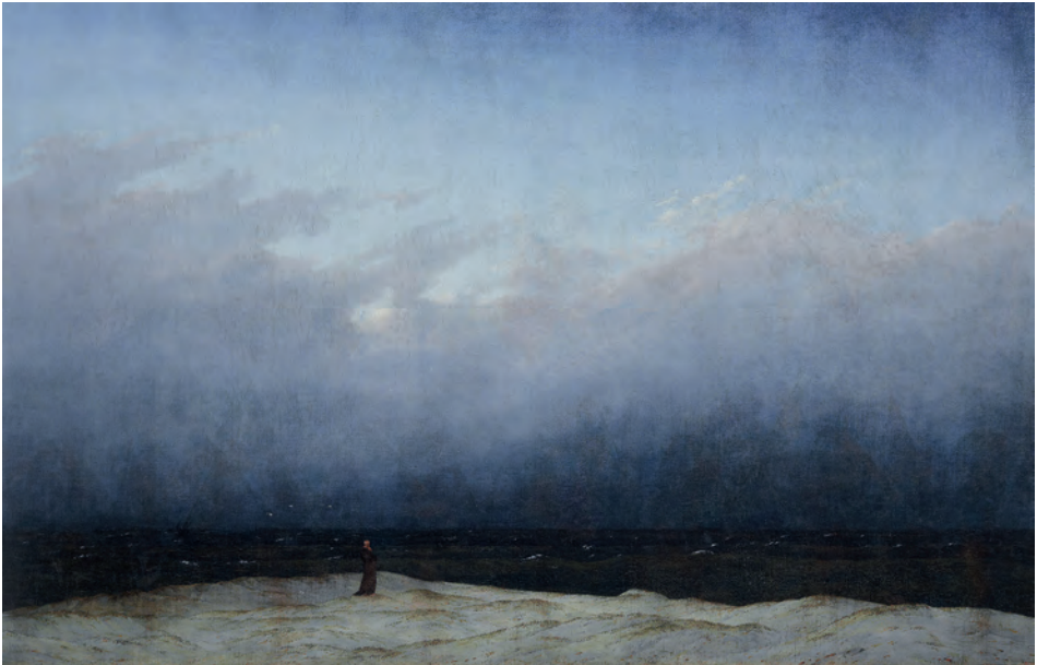
Abb. 2 Caspar David Friedrich, Gemälde »Mönch am Meer«, Endzustand nach der Restaurierung.