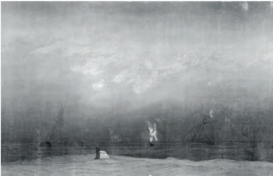
Abb. 3 Caspar David Friedrich, Gemälde »Mönch am Meer«, Infrarotaufnahme.