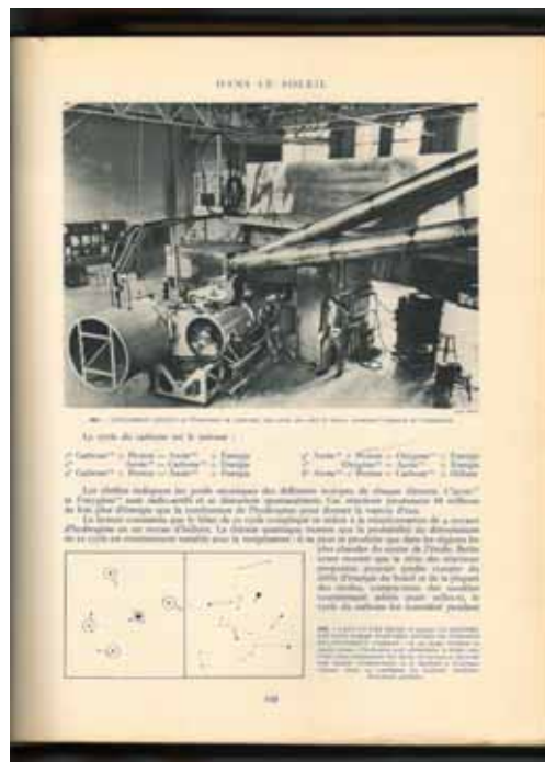
Figura 4 – Página 249

O discurso de popularização da ciência, com as reformulações que lhe são características, é bem marcado, neste exemplo, pela explicitação completa dos elementos que compõem o esquema. Nesta mesma página, encontramos mais um exemplo discursivo ligando linguagens diferentes no texto sobre o balanço estequiométrico das reações nucleares. Elas estão, logo abaixo da fotografia 351, representadas de forma descritiva.