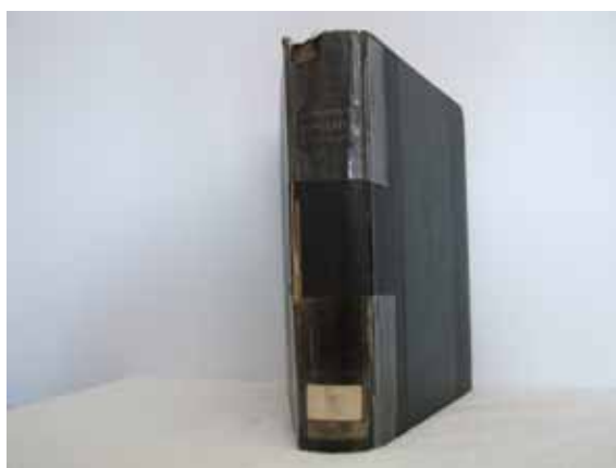
Fotografia 2 - O livro Astronomie Populaire