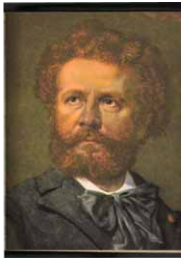
Figura 3 – Retrato de Camille Flammarion (Página 5)

O propósito de popularizar sem banalizar a ciência, é alcançado a partir de reformulações discursivas do discurso científico considerado como discurso primeiro. Discutimos como exemplo a página 249 (figura 4). Ao descrever o ciclo do carbono que ocorre na coroa de uma estrela, é mostrado, no alto da página, as instalações de um acelerador de partículas, ciclotron, da universidade da Califórnia (USA) e à esquerda, em baixo, um diagrama composto de dois quadros. O mais à esquerda tem uma representação de um átomo de Hélio e quatro átomos de Hidrogênio. As circunferências pontilhadas representam a trajetória de seus elétrons e as setas um possível sentido do vetor velocidade. No quadro à direita, o gás é representado sob o efeito de uma “temperatura elevada” e a legenda esclarece que os núcleos e os elétrons estão separados e, nessas condições, as reações nucleares são possíveis de acontecer. As diferentes partículas, núcleo de hidrogênio e hélio, estão representadas por discos de tamanhos diferentes. Elas se deslocam e se chocam em alta velocidade que são, nesse quadro, representadas pelas setas de comprimentos diferentes.