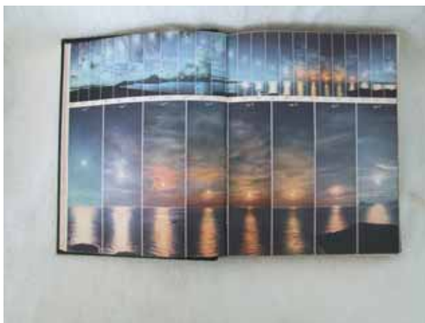
Fotografia 1 – O país do Sol da meia noite

A segunda esposa de Flammarion, Gabrielle, então secretária geral da Sociedade Astronômica da França – SAF, criada também por ele em 1887 quatro anos depois de fundar o Observatório de Juvisy, na região metropolitana de Paris, dirigiu juntamente com André Danjon a edição “inteiramente refeita” da obra em 1955, em uma tiragem de cerca de 5000 exemplares e 609 páginas (fotografia 2). A Sociedade Astronômica da França, atuante até os dias de hoje, preserva os propósitos de seus fundadores, ou seja, difundir as ciências do universo e fazer os amadores participarem de seu progresso 3 .