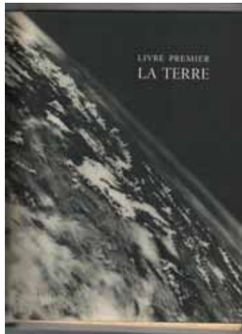
Figura 2 – Superfície da Terra (página 4).

O efeito didático visado nessa imagem é explícito na forma imperativa que segue a descrição da imagem: