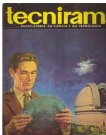
Figura 1 – Capa do fascículo 9: Explorando o céu (semanário de 1963) 1

Trazemos como exemplo, na figura 1, a capa do fascículo 9 da enciclopédia Tecnirama de 1963. Podemos supor que o ilustrador, ao produzir essa imagem, visou criar uma narrativa metafórica da leitura de uma carta celeste à observação da nebulosa de Caranguejo que é representada no alto da cúpula do observatório. Tal representação não se compromete com a realidade dos elementos de observação e sua legenda (no verso da capa do fascículo) os descrevem sem muitos detalhes.