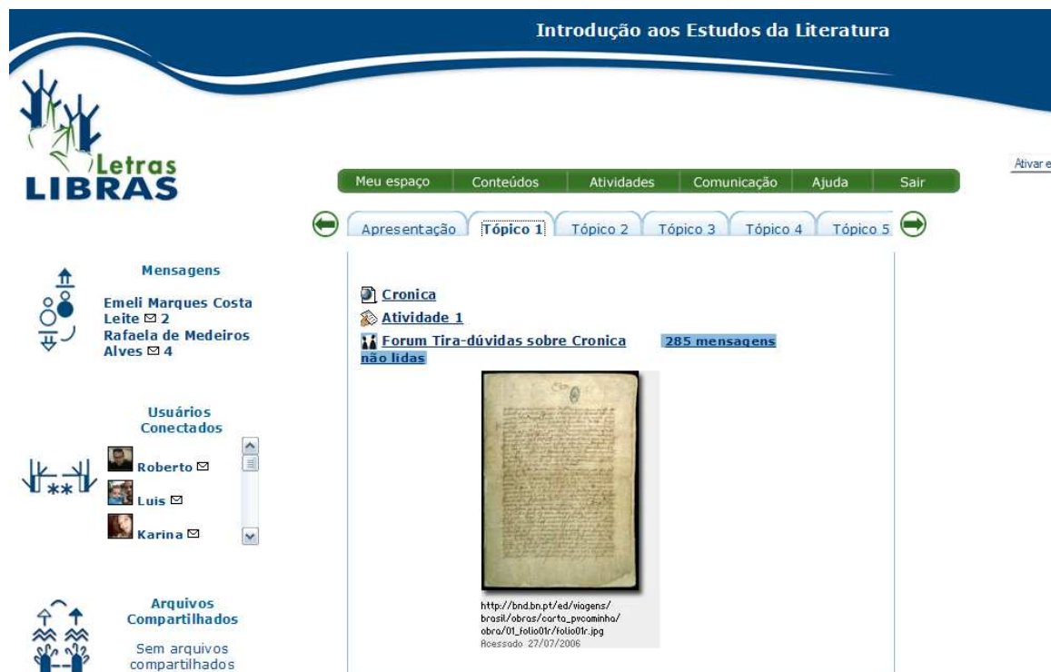
FIGURA 2 – Aspectos gráficos da interface do aluno em uma disciplina

Definiu-se que a navegação de Alunos pelo AVEA inicia-se pelo seu pólo, de onde este tem acesso as suas disciplinas. Para a navegação de professores, tutores e monitores, esta se inicia pelo Espaço da Equipe de Ensino. a partir do qual são acessados outros espaços, disciplinas ou pólos.