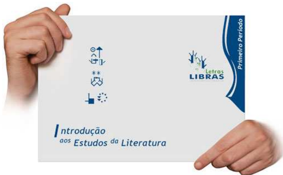
FIGURA 4 – Capa da hipermídia da disciplina

As primeiras disciplinas (figura 4) foram concluídas, após a realização de vários testes e aperfeiçoamentos. Após o primeiro bloco de implementação, foram implementadas mais onze disciplinas. Essas quinze disciplinas estão sendo revisadas e já passarão a apresentar um novo layout .