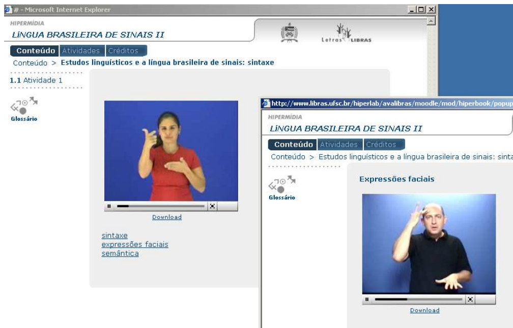
FIGURA 5 – Capas de vídeos

A decisão pela mudança da apresentação direta dos conteúdos na língua de sinais partiu da reflexão de alguns tradutores, professores fluentes na língua e designers instrucionais. Observou-se que não fazia sentido a apresentação do texto em português, uma vez que o objetivo é fazer a leitura dos textos diretamente na língua de sinais. Quando os textos estão na língua de sinais, eles passam a ser um novo texto. A tendência de alguns era verificar a correlação dos textos em português e na língua de sinais e não é este o objetivo, uma vez que a tradução da língua parte do texto em português e é recriada nesta língua. O objetivo é garantir que os conteúdos sejam apresentados na língua de sinais brasileira, sobrepondo-se ao texto motivador (inicial) que estava na versão escrita na língua portuguesa.