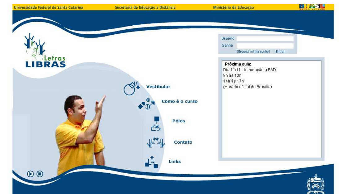
FIGURA 7 – Apresentação da página do Curso de Letras Libras

A página de entrada do curso é uma porta de acesso aos textos de domínio público, bem como de acesso às diferentes informações de interesse da comunidade do curso de letras libras. Uma das solicitações dos alunos foi a da criação de uma galeria de fotos. Esse interesse também reflete uma das formas de registro muito comuns entre os surdos. A história do curso