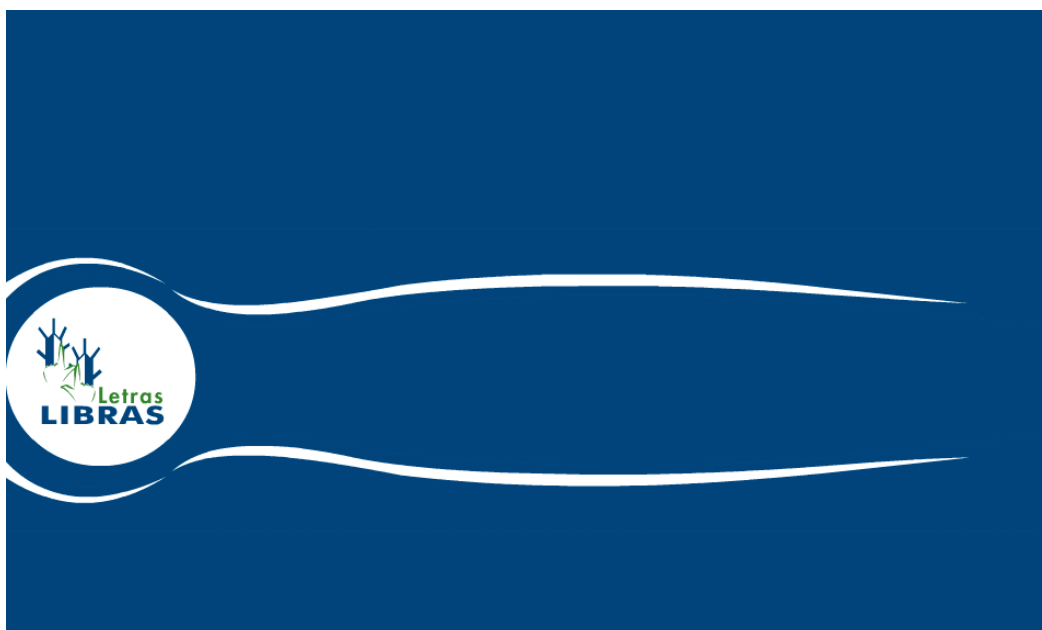
FIGURA 6 – Abertura da página do Curso de Letras Libras